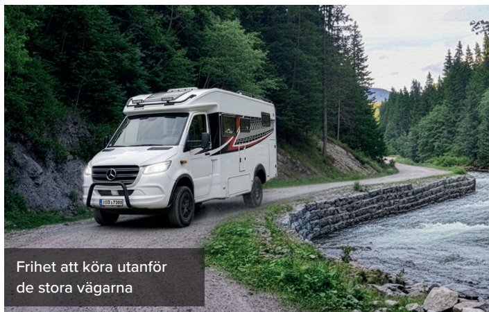
Frihet att köra utanför de stora vägarna

Invändigt följer TRAQ 750 LGB en klassisk och beprövad planlösning. Längst bak finns två långsgående enkelsängar, i mitten ett rymligt badrum och mittemot ett L-format kök. Längst fram återfinns en sittgrupp som vid behov kan bäddas. Totalt finns sovplatser för upp till fyra personer, men bilen är tydligt optimerad för två personer som prioriterar komfort, lastkapacitet och generösa ytor. Förvaringsmöjligheterna är väl tilltagna, med ett stort garage under sängarna som rymmer cyklar och större utrustning. Praktiska förvaringsväskor kan hängas inne i garaget (tillval). Samt en stor exteriör förvaringslucka under sittgruppen. Köket utmärker sig med ett högt, utdragbart skafferi som ger ovanligt god plats för proviant och utrustning.