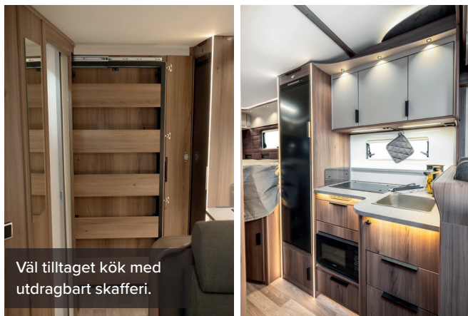
Väl tilltaget kök med utdragbart skafferi.

Novum TRAQ 750 LGB är anpassad för fricamping och året-runt-bruk. Elsystemet kan utrustas med solpanel, litiumbatteri och kraftig laddbooster. Värmen är vattenburen och kan drivas med gasol eller diesel (tillval). Isolerade och uppvärmda tankar samt elmanövrerad spillvattentömning understryker modellens vinteregenskaper. För den som vill förstärka bilens uttryck och funktion erbjuds ett offroad-inspirerat paket med grövre hjul, breddade hjulhus, takrails, extraljus och frontbåge. Sammantaget är Novum TRAQ 750 LGB ett tydligt steg framåt för KABE – en halvintegrerad husbil som kombinerar märkets välkända komfort med ökad framkomlighet och större rörelsefrihet.