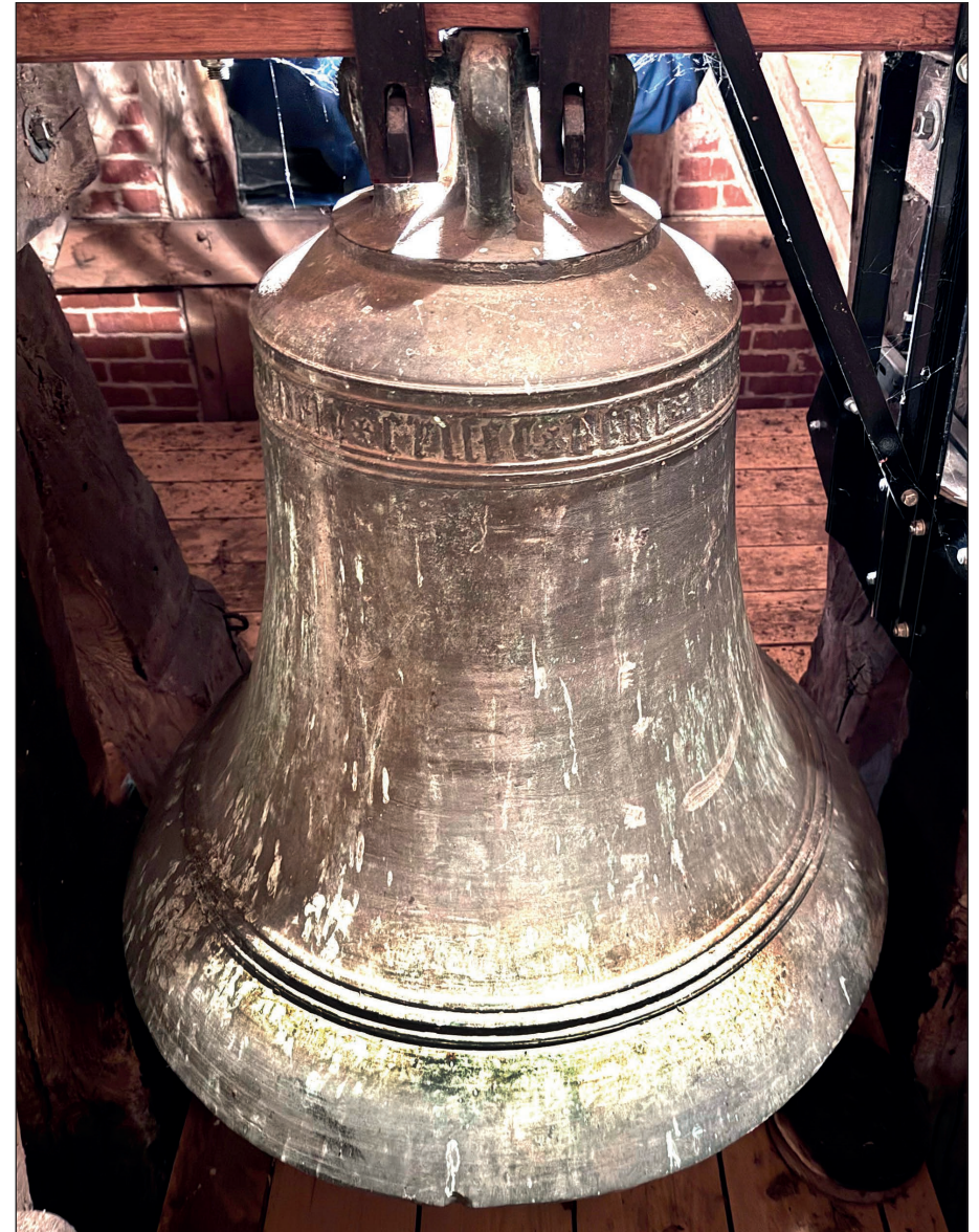
Glocke der St. Johannes-Kirche Zirkow