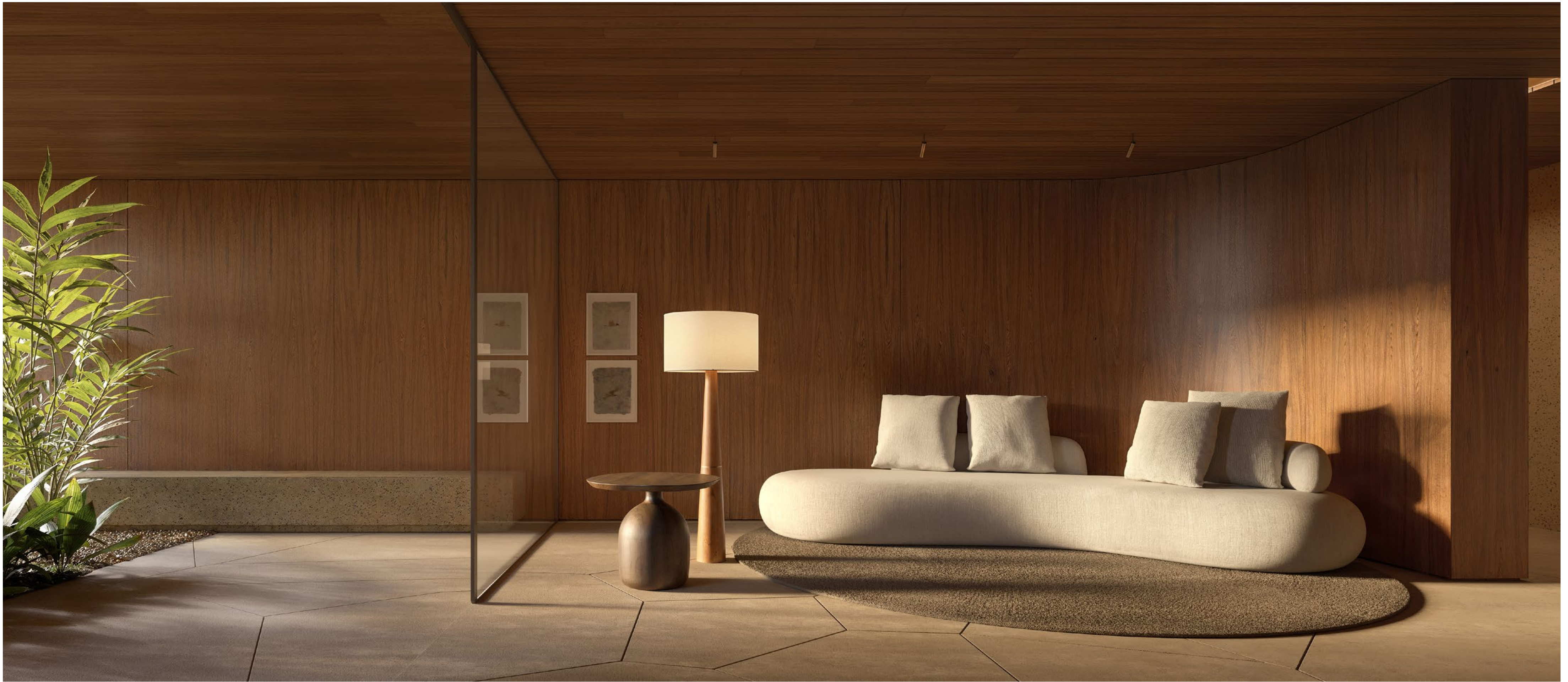
Hall de acesso