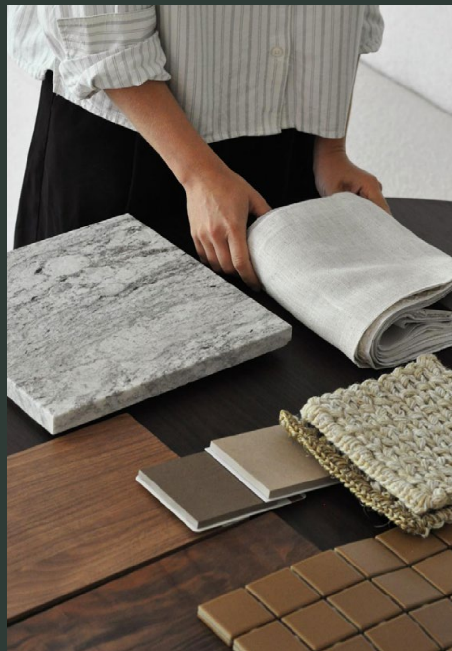
Branding Augusta Imagens Nex

Com mais de 50 anos de trajetória, a Knijnik assina a arquitetura do empreendimento com a precisão e o olhar apurado que marcam suas edificações, unindo tradição, sensibilidade e um compromisso constante com a boa arquitetura. A conceituação e os interiores levam a assinatura da Anil Arquitetura, que desdobra esse gesto em luz, forma e natureza, criando uma expressão sofisticada e atemporal.