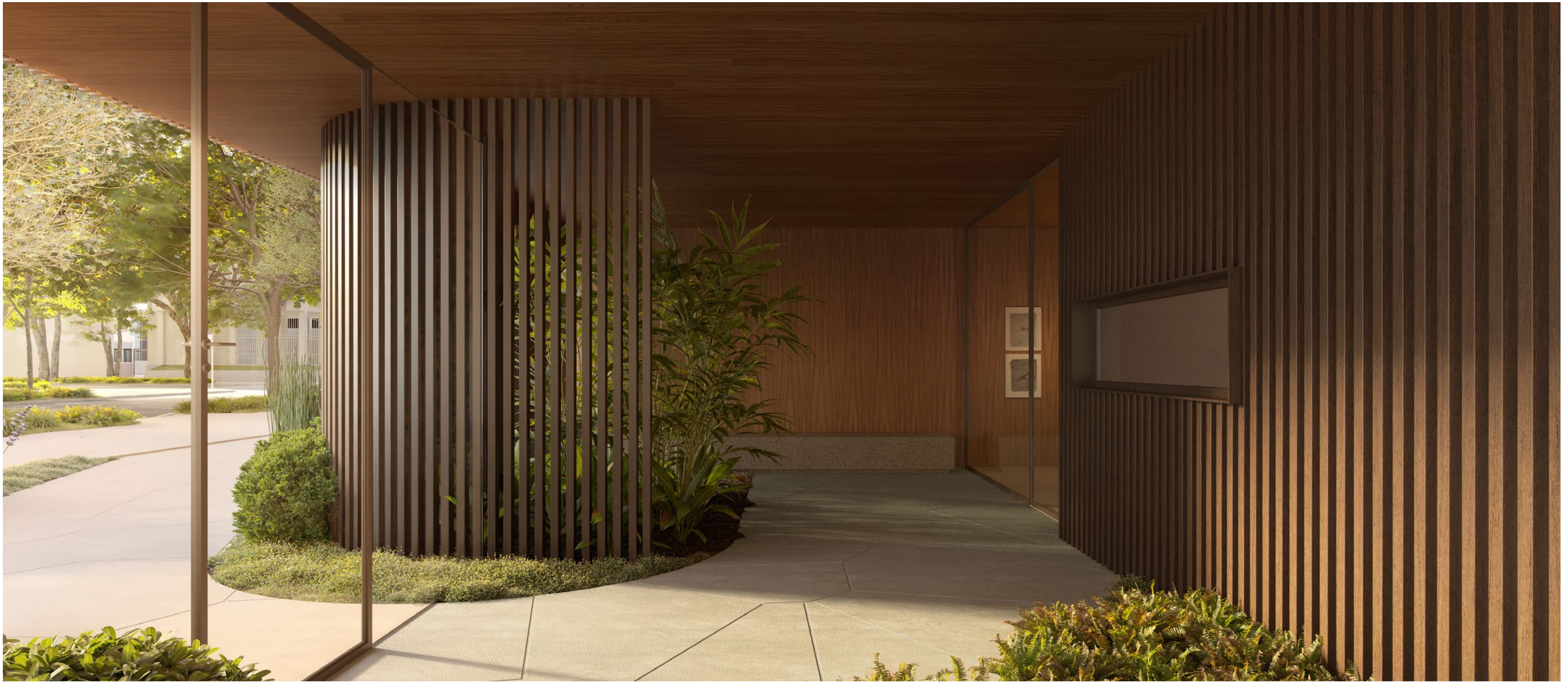
Eclusa de acesso