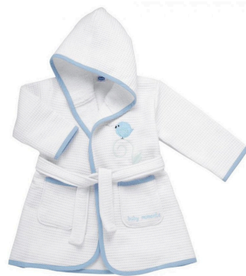
ACCAPPATOIO CON MANICHE