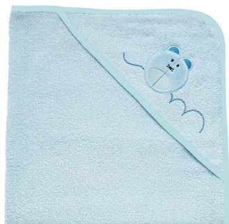
QUADRATO IN SPUGNA