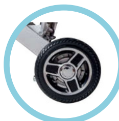
Ruote posteriori motorizzate