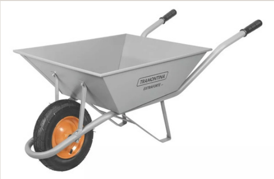
CARRINHO DE PEDREIRO