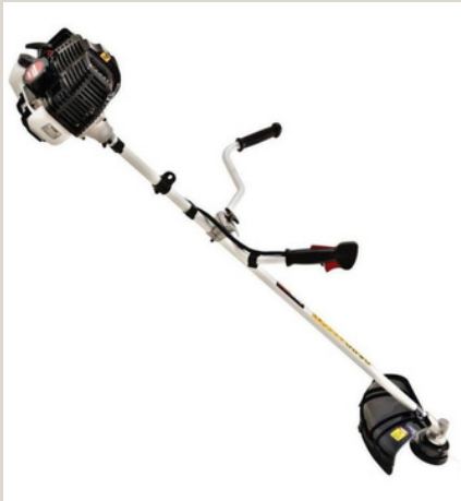
ROÇADEIRA A GASOLINA

A roçadeira é uma ferramenta, que tem como principal função a limpeza e manutenção de áreas cobertas por relva, grama, ervas daninhas e pequenos arbustos, em locais que não são acessíveis por um cortador de grama ou aparador de grama. Em nossos equipamentos, podemos utilizar lâminas de aço ou nylon, de acordo com a sua necessidade.