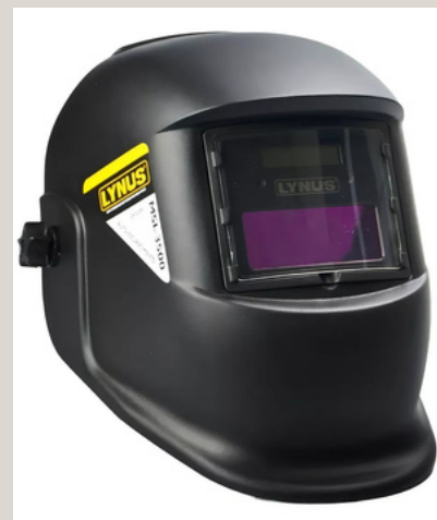
MÁSCARA DE SOLDA