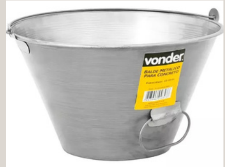
BALDE DE ALUMÍNIO