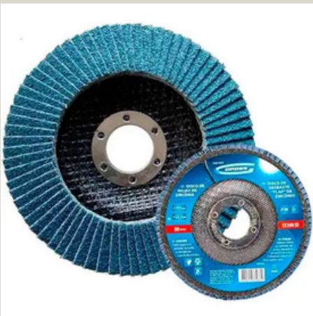
DISCO DE DESBASTE