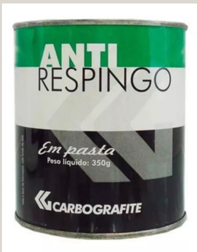
ANTI RESPINGO DE SOLDA