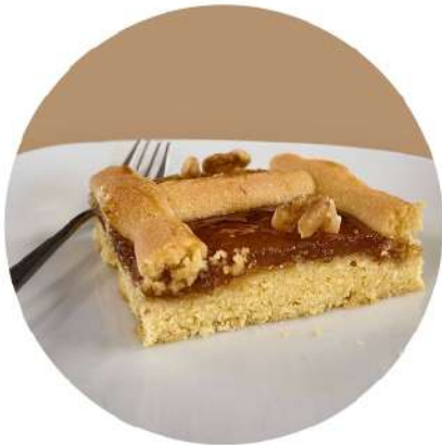
CROSTATA FICHI E NOCI