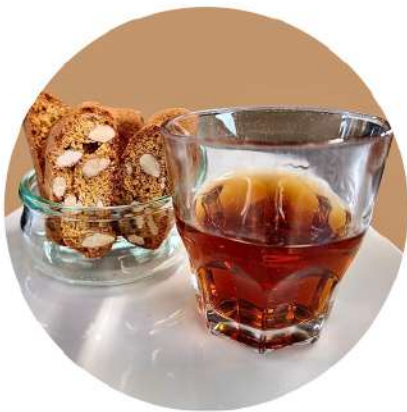
CANTUCCI E VINSANTO