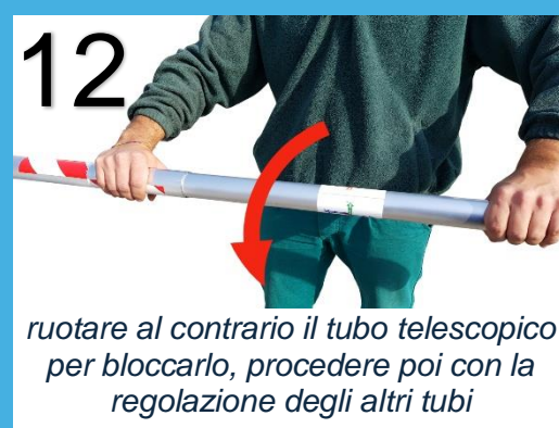
ruotare al contrario il tubo telescopico per bloccarlo, procedere poi con la regolazione degli altri tubi