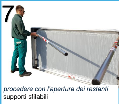
procedere con l'apertura dei restanti supporti sfilabili