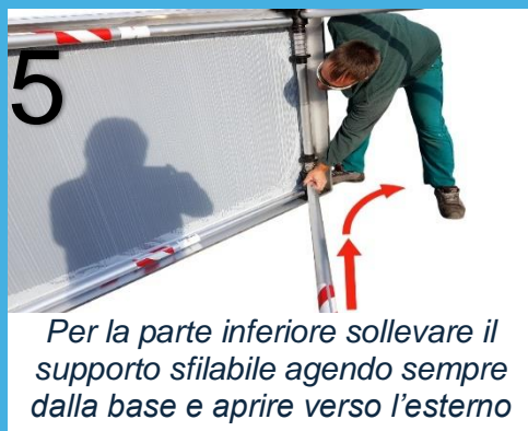
Per la parte inferiore sollevare il supporto sfilabile agendo sempre dalla base e aprire verso l'esterno