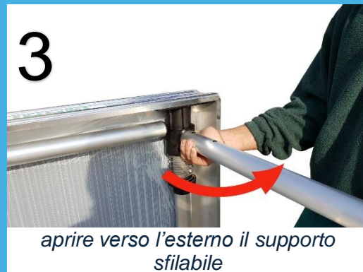
aprire verso l'esterno il supporto sfilabile