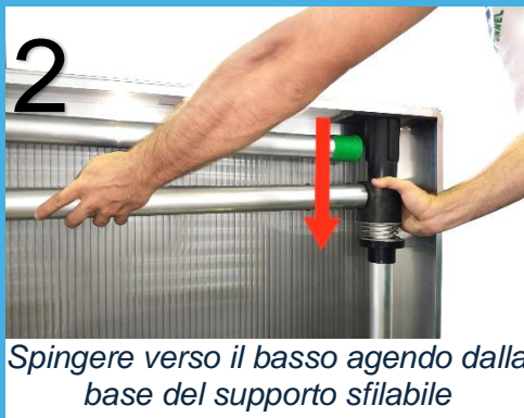
Spingere verso il basso agendo dalla base del supporto sfilabile