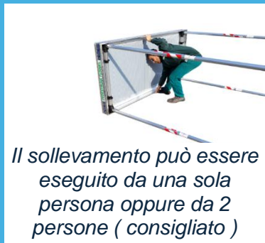
Il sollevamento può essere eseguito da una sola persona oppure da 2 persone (consigliato)