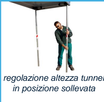
regolazione altezza tunnel in posizione sollevata