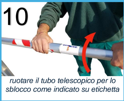
ruotare il tubo telescopico per lo sblocco come indicato su etichetta