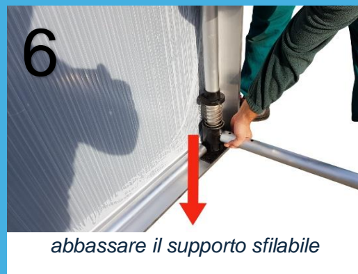
abbassare il supporto sfilabile