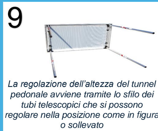
La regolazione dell'altezza del tunnel pedonale avviene tramite lo sfilo dei tubi telescopici che si possono regolare nella posizione come in figura o sollevato