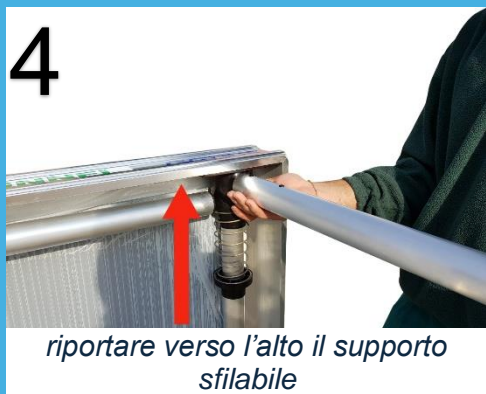
riportare verso l'alto il supporto sfilabile