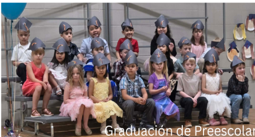
Graduación de Preescolar