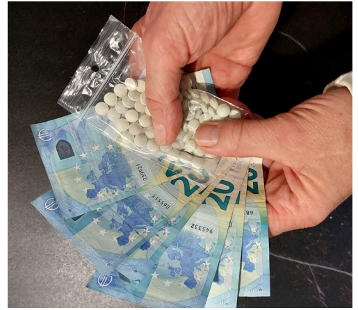
Het begint met een pakje wegbrengen.

DE REDACTIE ZORGT DAT UW BERICHT BIJ DE JUISTE PERSOON TERECHT KOMT.