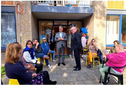
Bij het Muntpunt spraken commissaris en burgemeester met bewoners.