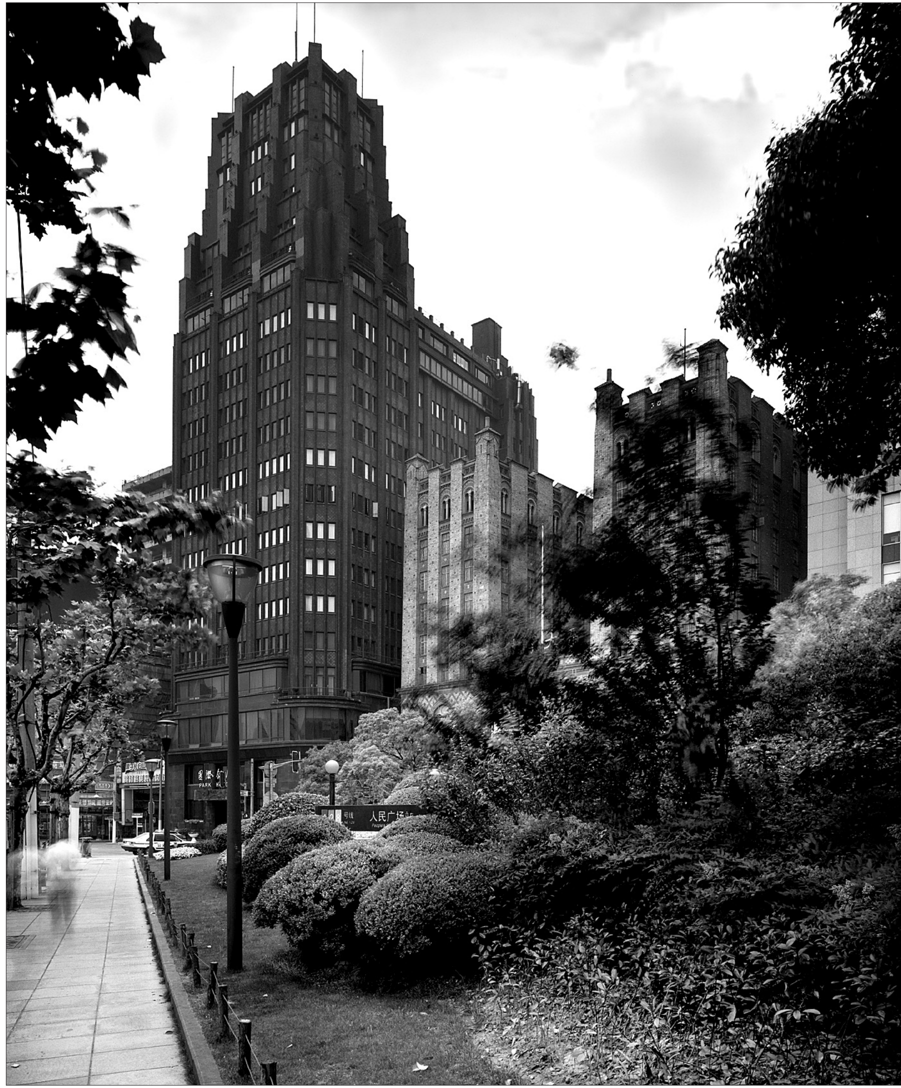
Sanghaj egyik jelképe, a Park Szaalló, Hudec talán legfontosabb munkája. Leküzdötte a laza talajt