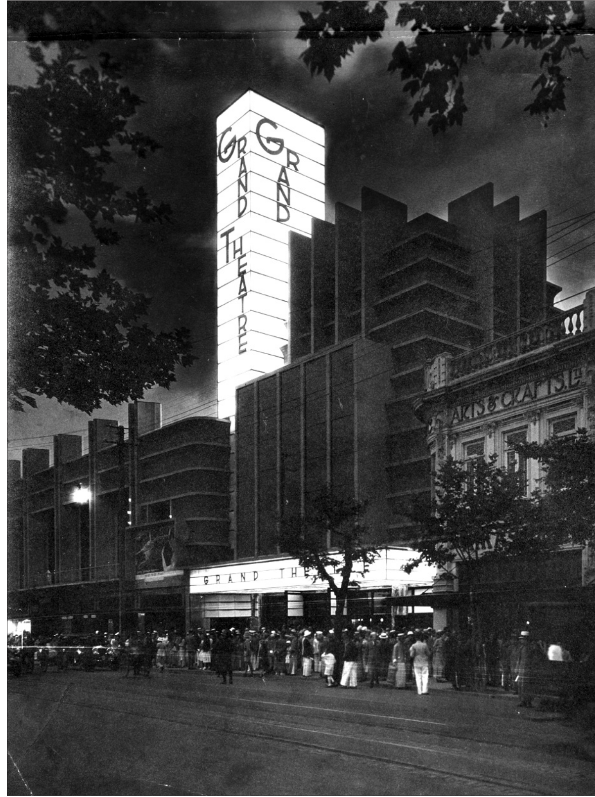
A Grand Theatre a maga korában Ázsia legnagyobb szórakoztató-központja volt

A Hudec Kulturális Alapítvány a párizsi Balassi Intézetben áprilisban több rendezvényt is szervezett egyik nemzetközi szinten leghíresebb építészünk, a fiatal korban külföldre szakadt Hudec László népszerűsítésére. „Az ember, aki felépítette Sanghajt”, mindmáig nem foglalhatta el méltó helyét a magyar építészet történetében. Pedig érdemes felfedeznünk, mert ha nem tesszük, a végén szlovák mérnökzeniként vonul be a történelembe.