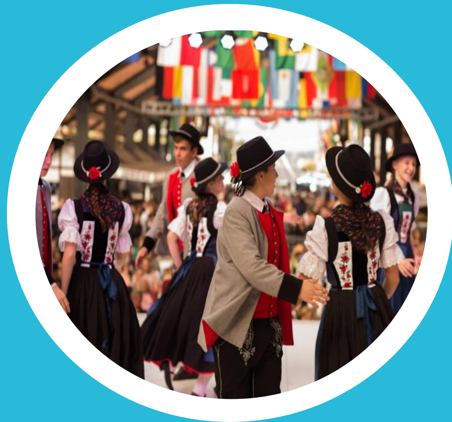
Cultura e Tradições