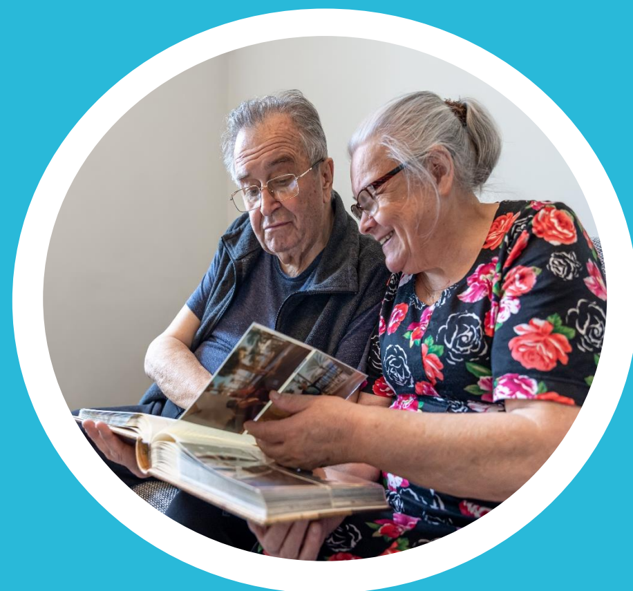
História de moradores

Pautas que envolvem o interesse da sociedade.