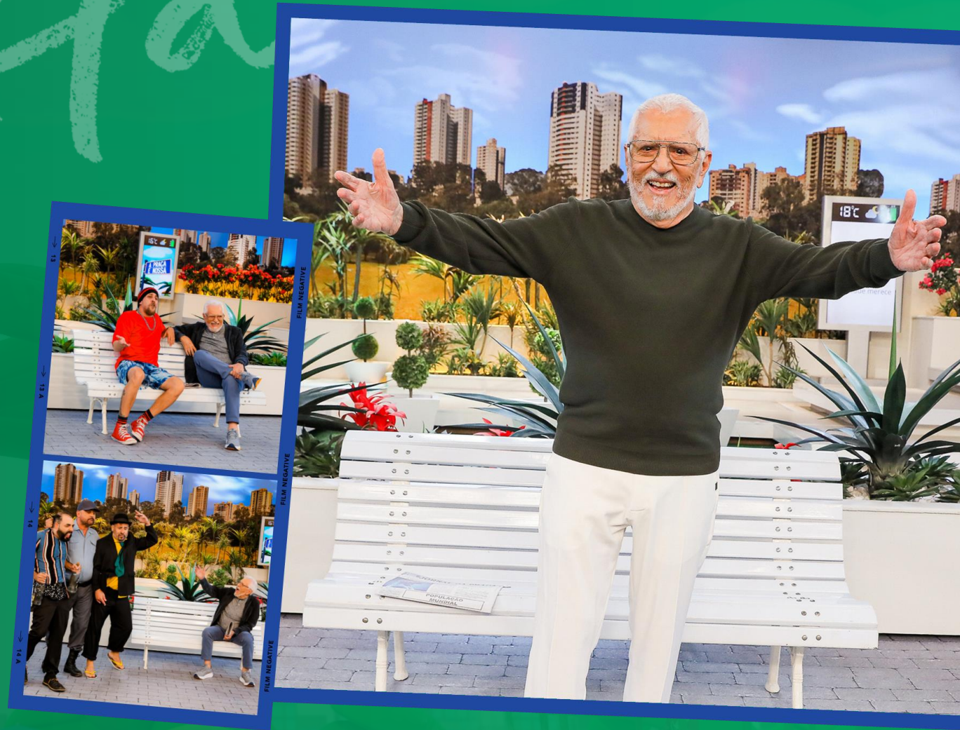
figura icônica que mantém a tradição e a qualidade do humor de maneira vibrante e atual