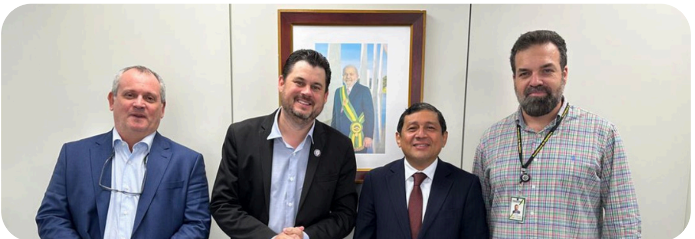
Articulação entre ANM e lideranças no RS.