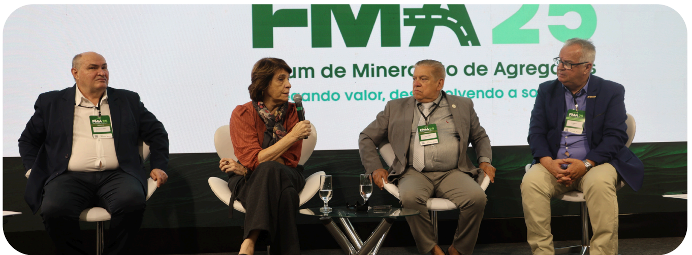
Painel discute a integração da mineração ao planejamento urbano.