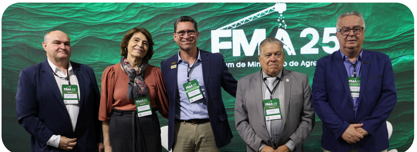
Lideranças do setor reunidas no evento.