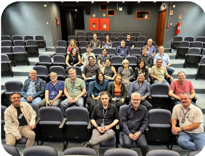
Equipe técnica da ANM e representantes do setor alinham diretrizes para atuação no RS.

Na sequência, a comitiva esteve na Casa de Governo do Rio Grande do Sul, estrutura criada para coordenar as ações de reconstrução após as enchentes. A reunião reforçou a inserção da mineração nesse contexto, especialmente diante dos efeitos provocados pelo deslocamento de sedimentos e pela formação de depósitos de areia em diferentes regiões. Durante o período mais crítico, a ANM adotou medidas excepcionais, como a prorrogação de prazos em processos minerários, evidenciando a importância de mecanismos regulatórios capazes de responder com agilidade em situações emergenciais.