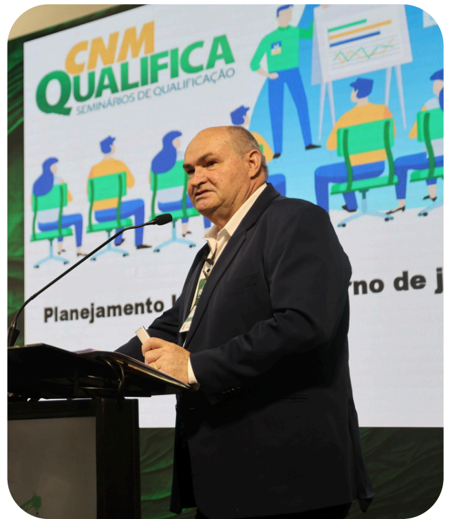
Apresentação reforça o planejamento territorial da mineração.

A mensagem central é clara: desenvolvimento urbano e atividade mineral precisam ser integrados de forma estratégica ao planejamento territorial. Sem essa visão, corre-se o risco de comprometer o abastecimento de insumos essenciais e encarecer significativamente o desenvolvimento urbano.