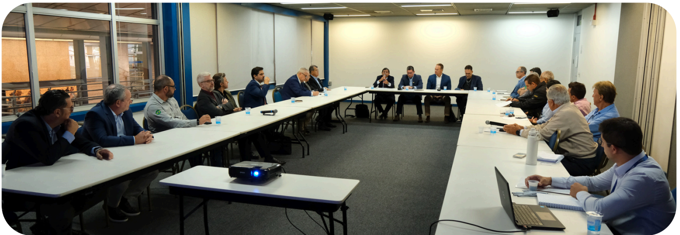
Reunião reforça diálogo e busca por mais agilidade no setor mineral.

Para o segmento de brita e agregados, representado por entidades como Sindibritas e Agabritas, esse movimento reforça a importância da participação ativa nas discussões estratégicas e do diálogo contínuo com os órgãos reguladores. Em um cenário de reconstrução, adaptação e retomada, a mineração reafirma seu papel como atividade essencial ao desenvolvimento econômico, à infraestrutura e à reorganização territorial do Rio Grande do Sul.