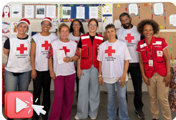
Veja o vídeo

Cerca de 150 pessoas foram beneficiadas.