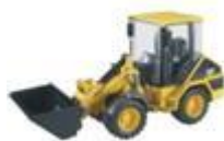
Pala caricatrice frontale