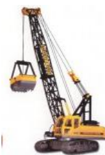
Escavatore a fune