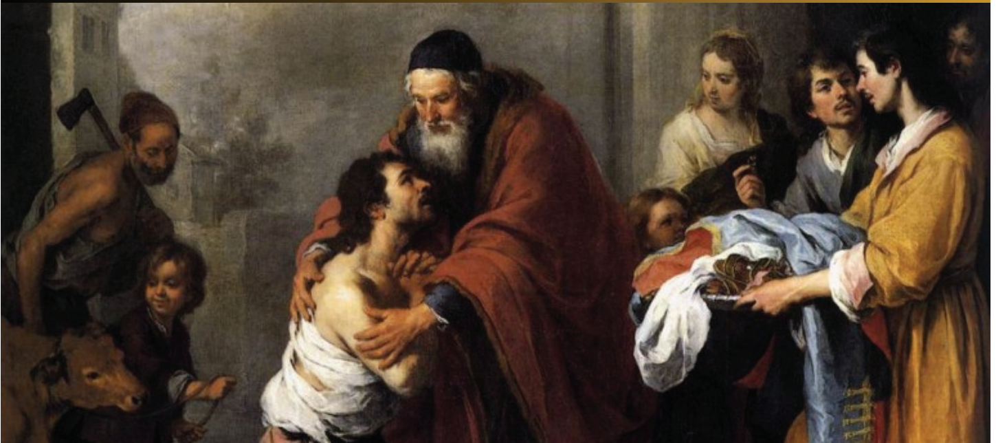
The Return of the Prodigal Son, Bartolome Esteban Murillo