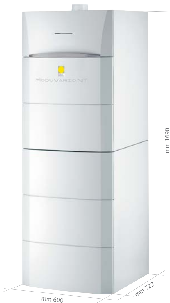
Assemblaggio in verticale

ModuVario NT è ideale per abitazioni di medie grandi dimensioni, con elevato fabbisogno di acqua calda sanitaria. Configurata per la produzione di acqua calda sanitaria e riscaldamento, la caldaia è dotata di predisposizione al solare termico. È abbinabile a bollitore da 100 o 160 litri per soddisfare le diverse esigenze. È assemblabile in verticale e in orizzontale per adattarsi ai differenti spazi abitativi. Per ottenere la classe energetica A+ ed accedere alle detrazioni fiscali è sufficiente abbinare una regolazione Paradigma.