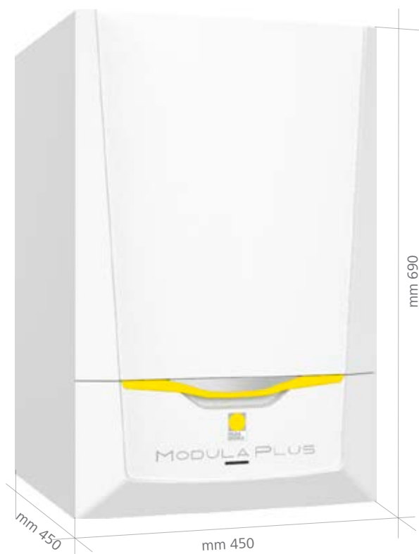
(Misure versione Modula Plus S/DS/C)

La gestione climatica avviene attraverso una sonda esterna che permette alla caldaia di minimizzare i consumi di gas metano. Lo scambiatore in alluminio silicio mantiene le performance della caldaia elevate, anche quando la caldaia è installata in impianti ad alta temperatura. Per ottenere la classe energetica A+ ed accedere alle detrazioni fiscali è sufficiente abbinare una regolazione Paradigma.