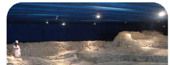
Estanque Celtibérico - Laguardia