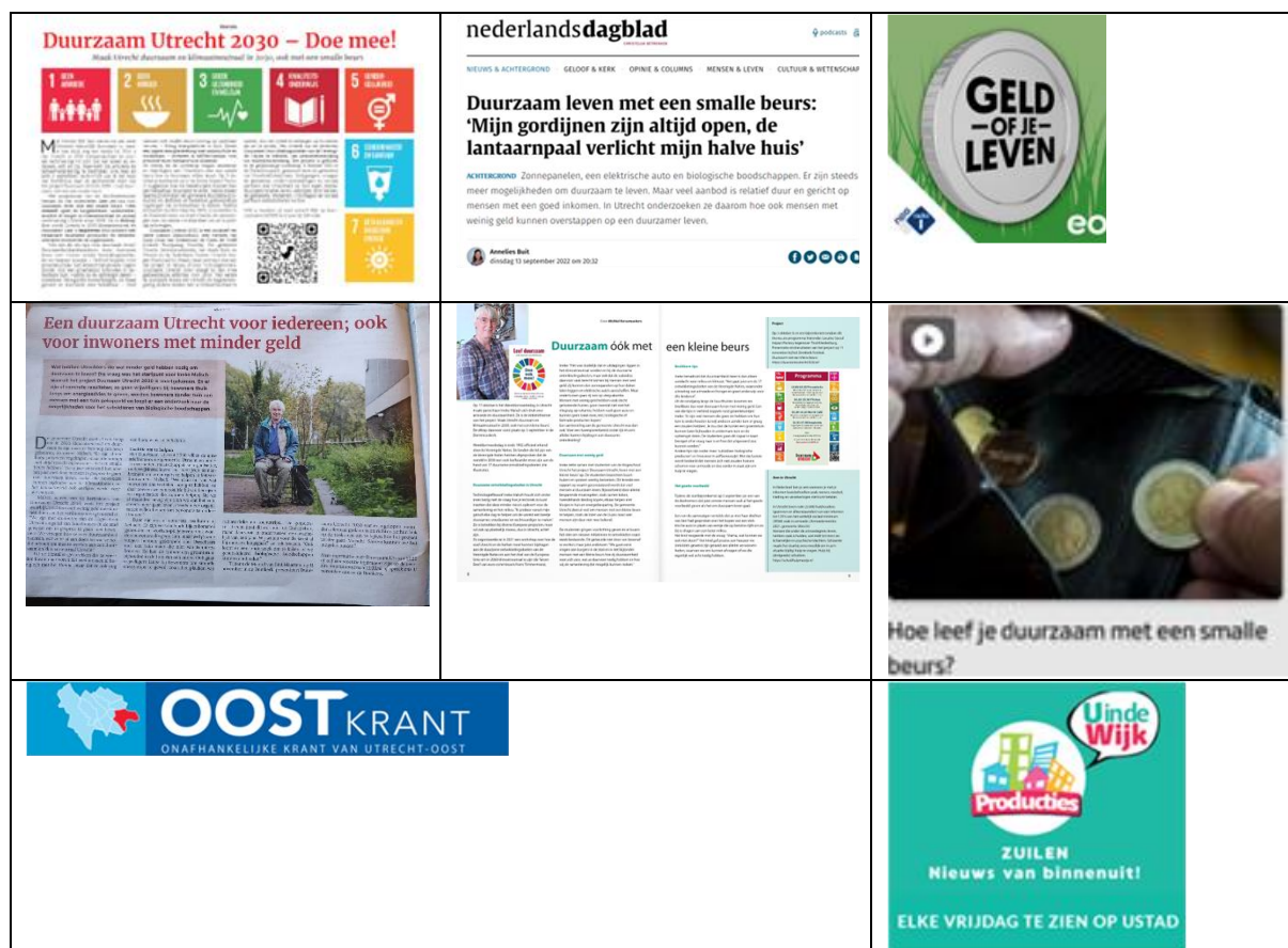
Figuur 3: compilatie van media aandacht.

Vanaf 26 augustus zijn artikelen of interviews over Duurzaam Utrecht 2030 in de volgende media verschenen: