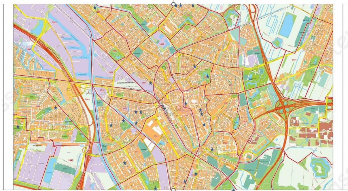
Figuur 2: locaties van gesprekken over duurzaam leven met smalle beurs.

Werkende weg hebben tientallen organisaties en personen bijgedragen aan activiteiten van Duurzaam Utrecht 2030 (kerken, onderwijsinstellingen, maatschappelijke organisaties, bedrijven, gemeente en politici, zie bijlage 1). Met financiële ondersteuning van de gemeente Utrecht (Initiatievenfonds), Kerk en Wereld en Katholieke Caritas Utrecht, medewerking van studenten van de Hogeschool Utrecht en HAS Hogeschool in Den Bosch en tientallen partners hebben we in het najaar van 2022 gewerkt aan oplossingen voor drie van de genoemde tips: verbind koppels rond groentetuintjes, subsidieer biologische boodschappen en geef energieadvies in huis.