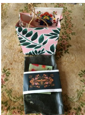
Figuur 5: bijenwasdoekjes en materialen om ze zelf te maken

Op 8 en 9 oktober voerde een groep ervaringsdeskundigen de theatervoorstelling ‘Zie de mens’ op in Het Wilde Westen (Oog in Al). Verspreid over de gymzaal, tussen het publiek, vertelden negen acteurs van de Joseph Wresinski Cultuur Stichting hun verhaal en gingen met elkaar in dialoog over hoe het is om arm en kwetsbaar te zijn. Ze brachten helder de menselijke behoefte om zich te uiten en gehoord te worden over het voetlicht. De ongeveer twintig bezoekers per keer konden vooraf en na afloop met de acteurs in gesprek. Een groep studenten van ARTEZ volgde de voorstelling als uitgangspunt van een vervolgopdracht. De organisatoren organiseerden ook een nagesprek voor geïnteresseerden.