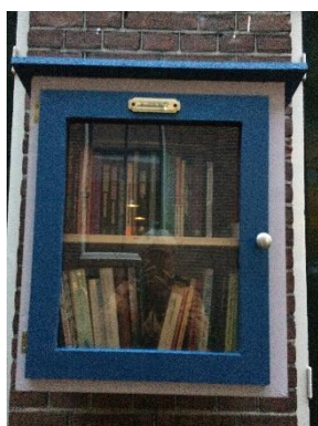
Figuur 6: een mini-bieb

In meer en meer wijken worden weggeefwinkels geopend. In Lunetten is de weggeefwinkel van stichting Limoenz op dinsdag en donderdagochtenden open, en ook in Rivierenwijk werkt de Nieuwe Jutter aan een weggeefwinkel. Verschillende buurthuizen hebben ook weggeefkasten ingericht, zoals Het Knooppunt in Lunetten of het Hart van Noord op Kanaleneiland. En op straat verschijnen steeds meer mini-biebs of weggeefkasten bij particulieren.