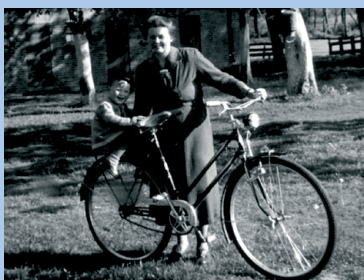
Neuenhaus, den 28.03.2021 (zum 30sten Todestag meiner Mutter 28.03.1991)

Du hast mich geboren, gestillt Mein Leben mit Sinn erfüllt Genährt, meinen Geist und Körper Es auszudrücken fehlen die Wörter Hast mir das Laufen beigebracht Alles fein, mit bedacht Gebetet für meine Seele Damit mir's an nichts fehle. Hast mich mit Liebe überschüttet Getrieben von Liebe, behütet Vor allerlei Gefahren Vor der Geister Gebaren Von Liebe getrieben Mich gelehrt zu lieben Aufs Leben vorbereitet Meinen Blick geweitet Gebetet für mein Sein Dass kein Stein Mir den Weg versperre Und nicht im Heute verharre Gott solle mich immer tragen So könne ich das Leben wagen Denk ich an dich So schlendere ich In großer Dankbarkeit Zurück in die schöne Zeit!