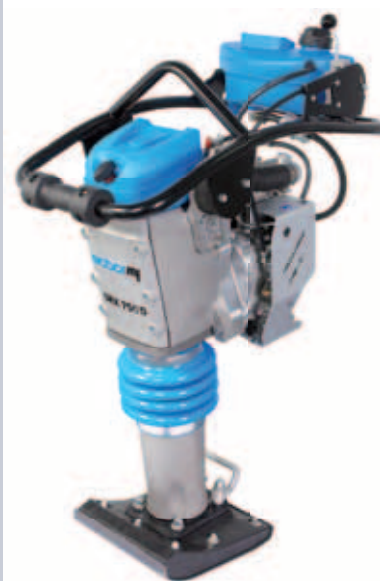
SRX 750 D