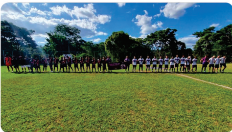
• Copa Proza da Várzea de Fut7.