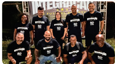
• 2º Torneio de Integração de futebol no Clube do Sindicato.