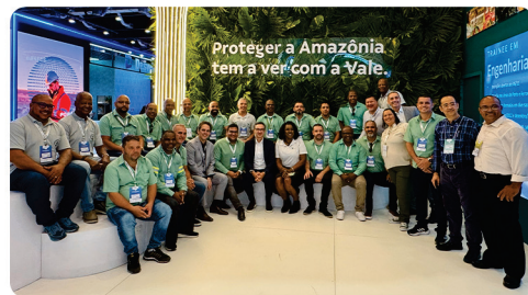
• Encontro com o Presidente da Vale e Conselheiros, em Salvador. ( EXPOSIBRAM 2025 )