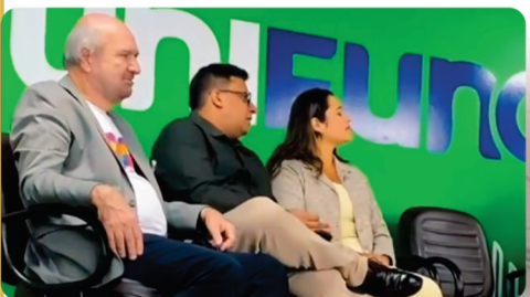
• Participação no I Seminário Funcesi Azul.