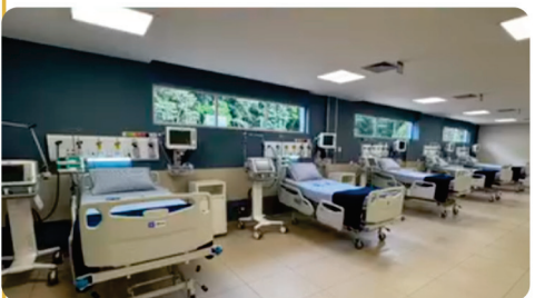
• Parauapebas-Carajás / PA Inauguramos 10 novos leitos de UTI no Hospital Yutaka Takeda