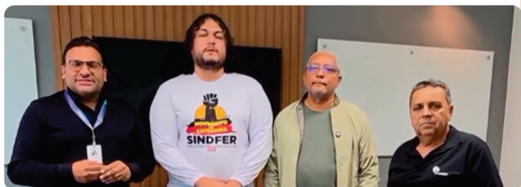
• Reunião Conselho do Pasa – Menor Reajuste dos últimos 4 anos.