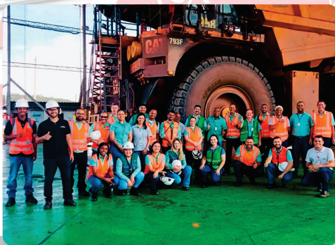
• Conquista, novo contrato de limpeza e higienização a seco na Vale, garantindo mais conforto aos trabalhadores.