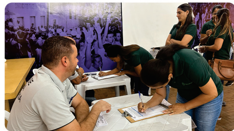
• Assembléia Belmont