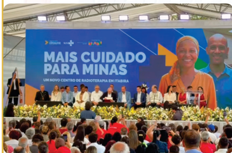
• Inauguração do Centro de Radioterapia do Hospital Nossa Senhora das Dores (HNSD) com a presença do Presidente da República, Lula