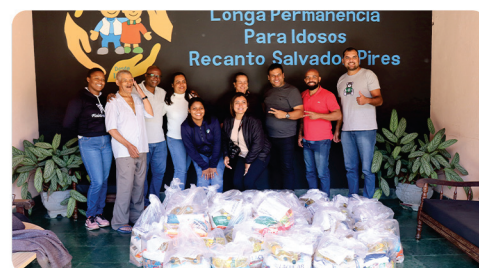
• Entrega de alimentos arrecadados na semana do trabalhador