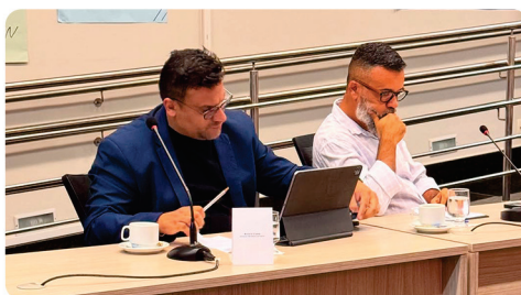
• Audiência pública realizada pela comissão de Minas e Energia da ALMG em Conceição do Mato Dentro_MG