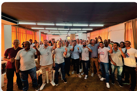
• Culto Ecumênico