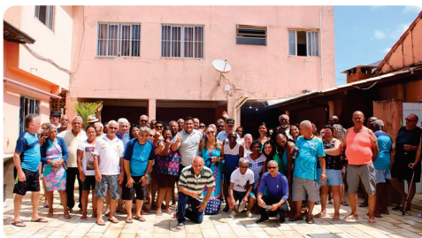
• Excursão colônia de férias dos aposentados. ( CAP - Comissão de Aposentados e Pensionistas )