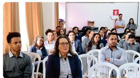
• Assembleia e ACT dos Funcionários do Metabase