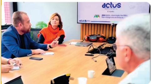
• Reunião com o Instituto Social Actus e presidente do PASA.