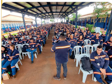
• Assembleia Anglo