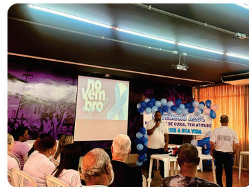
• Novembro Azul, cuidar também é coisa de homem!