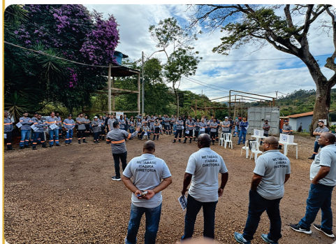
• Assembleia Serra Leste