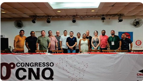
• 10º Congresso Nacional do Ramo Químico – CNQ_CUT.