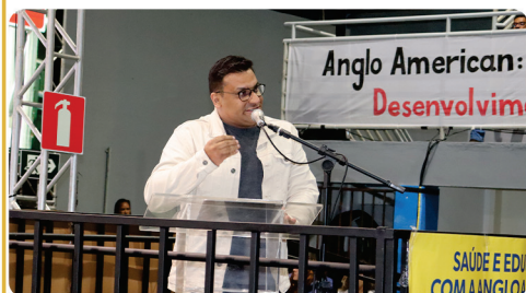
• Audiência pública ( comissão de Minas e Energia da ALMG ) em Conceição do Mato Dentro_MG.