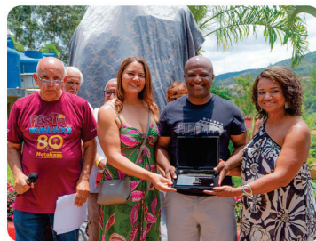
• Inauguração Placa do Clube