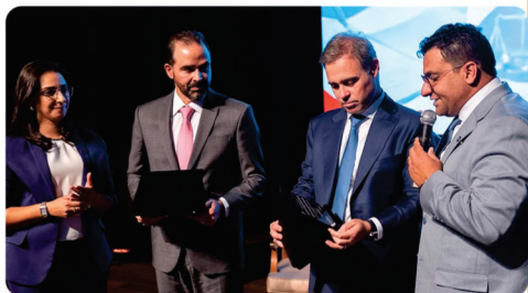
• 1ª Jornada Jurídica de Itabira OAB Itabira e Metabase.