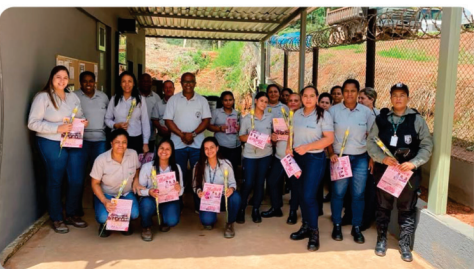
• Panfletagem em Canaã.