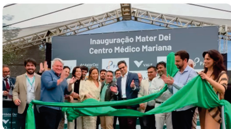
• Inauguração do Centro Médico Mariana, fruto de parceria entre Vale, PASA e Mater Dei.