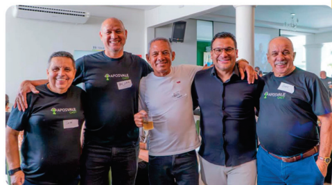
• Encontro dos Amigos das Oficinas Centralizadas Jacutinga, Conceição e Cauê (CVRD_Vale).