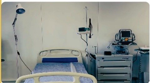
• Anglo American inaugura Posto Avançado de Saúde na mina de Conceição do Mato Dentro.