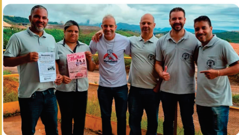
• Panfletagem e diálogo com os trabalhadores da Anglo American.