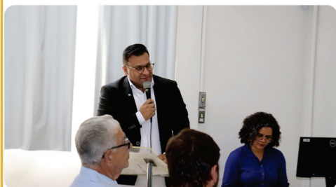
• Participação no anúncio histórico da Vale - investimento milionário no HNSD. ( 5,5 milhões )