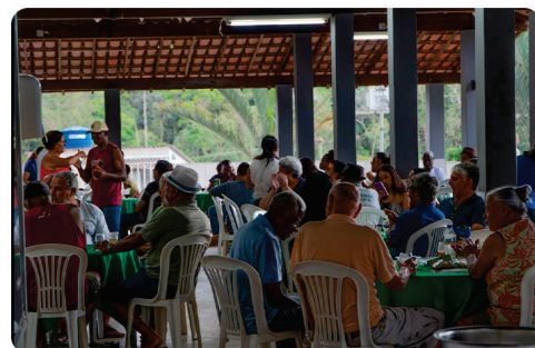
• Reunião e Confraternização da CAP