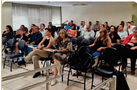
• Sindicato presente e atuante nos debates sobre a saúde dos trabalhadores no pós-Mariana.