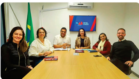
• Parceria com a OAB.