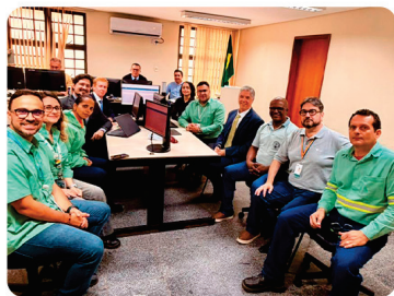
• Acordo judicial com a Vale reforça a proteção aos trabalhadores.