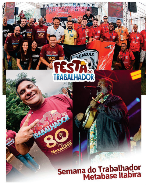
• Semana do Trabalhador - ações e celebrações em toda a região.