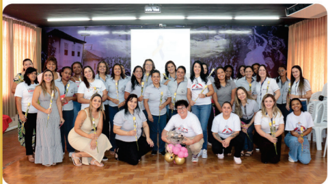
“Café com Elas” celebra o Mês da Mulher.