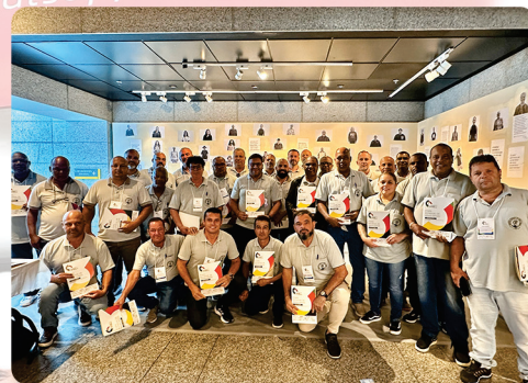
• Conferência Nacional do Trabalho