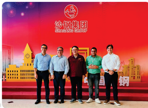
• Reunião com a potente siderúrgica chinesa SHAGANG GROUP