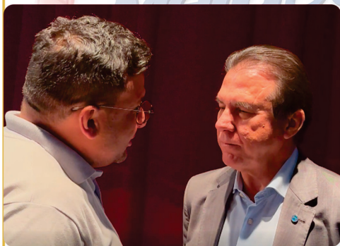
• Diálogo com o ministro do Trabalho e Emprego, Luiz Marinho