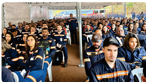
• Assembleias PLR Anglo American