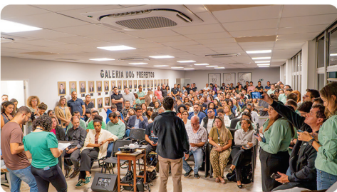
• Reunião pública na prefeitura municipal de Itabira.