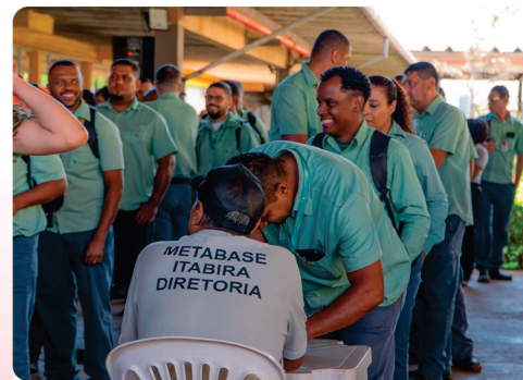
• Assembleia Vale