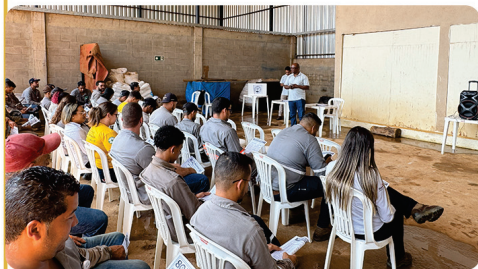
• Assembleias ACT Mig Mineração