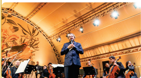
• Evento Orquestra Ouro Preto emocionando o público.