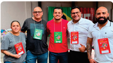
• 16ª Plenária da CUT Minas.