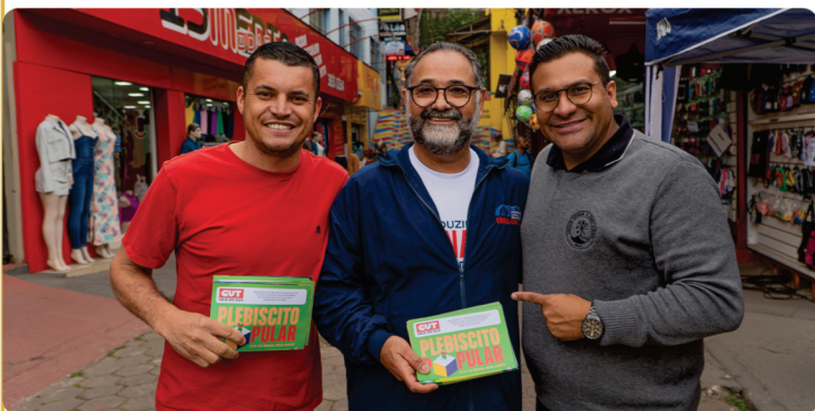
• Plebiscito Popular