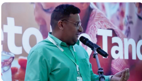
• Lançamento da pedra fundamental da obra de captação de água do Rio Tanque em Itabira. Investimento de R$1,3 Bilhão da VALE.