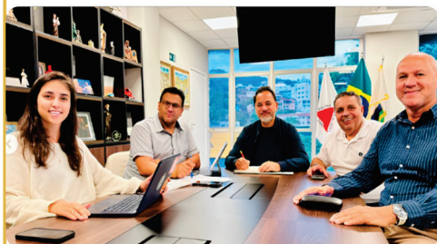
• Diálogo pelo desenvolvimento sustentável, reunião sobre projeto de fábrica de briquetes em Itabira.