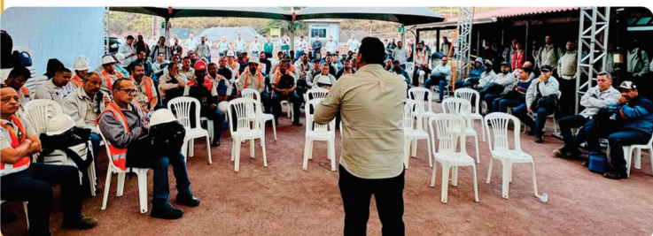
• Assembleia ACT Bemisa.