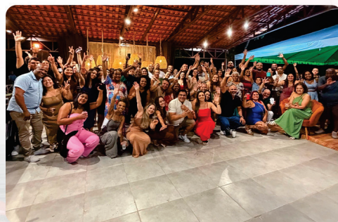
• Confraternização do Sindicato Metabase