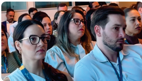
• Reunião com profissionais das clínicas PASAS em todo o Brasil.