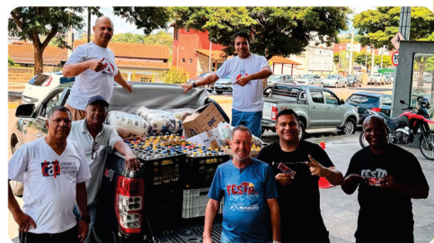
• Semana do Trabalhador 2025, Solidariedade e luta!