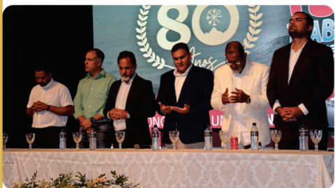
• Documentário 80 anos - Abertura da Semana Municipal do Trabalhador.