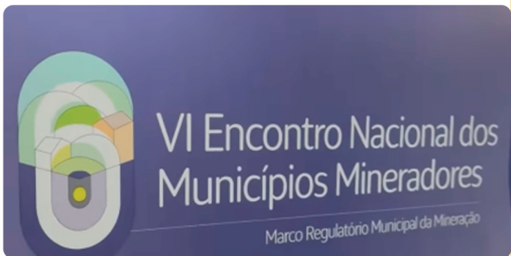
• Participação no Congresso da AMIG