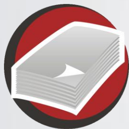
Vertical Birôs e Gráficas

Oferecemos soluções especiais sob medida para mercados específicos.