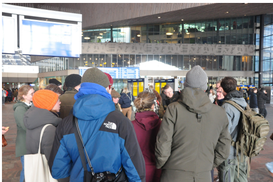
Ook vandaag zijn we met een groep van bijna dertig geïnteresseerden.

Na deze prikkelende aftrap zet de groep zich in beweging. We lopen richting het Oude Noorden, klaar om de stad met wéér andere ogen te bekijken.