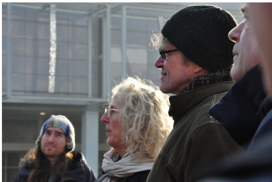
Een levendige uitwisseling: de boude stellingen van Peeren leiden tot discussie binnen de groep.

Muziek is dan geen onderdeel van het dagelijks leven, maar een product dat je consumeert. Zou dit ook anders kunnen?