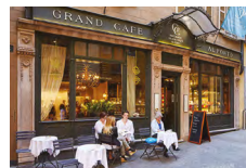
Grand Café Al Porto Lugano, Via Pessina 3 Tel. 091 910 51 30