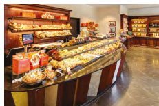
Al Porto Ascona* Ascona, Viale Mte Verità 11 Tel. 091 791 12 62