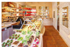
Al Porto Piazza Ascona* Ascona, Piazza G. Motta Tel. 091 791 20 36