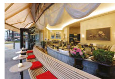
Al Porto Café Lago* Locarno, Viale Verbano Tel. 091 743 56 83