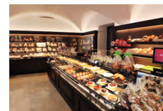
Al Porto Portici* Locarno, Largo Zorzi 10 Tel. 091 756 20 56