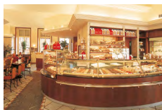
Al Porto Piazza Stazione* Locarno, Piazza Stazione 6 Tel. 091 743 65 16