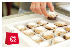
Boutique online* www.alporto.ch 24/24 h