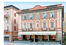
Al Porto Bellinzona* Bellinzona, Piazza Stazione Tel. 091 743 56 84

© Confiserie Al Porto SA. Con riserva di eventuali cambiamenti di prezzo e di assortimento. Fanno stato le condizioni pubblicate su alporto.ch.