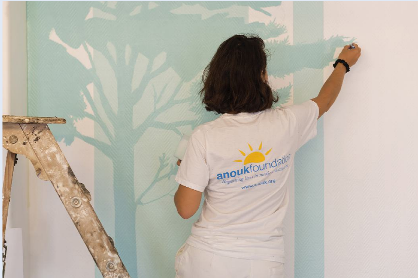
© Thierry Dana – Fondation Anouk

Qui sont vos patients et comment ont-ils vécu la présence des fresques dans les lieux de soin ? Idem pour les collaborateurs ?