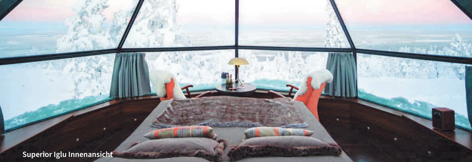
Superior Iglu Innenansicht