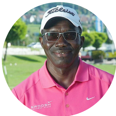
PGA Pro Lucky Suleiman

REISEBAR GmbH Stallikerstrasse 1b CH-8906 Bonstetten