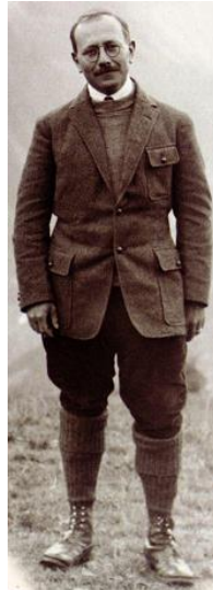
Marc BLOCH, « un historien engagé dans la Résistance » (chrd Lyon)

A la publication du statut des Juifs du 21 octobre 1940, Marc Bloch fit partie des dix professeurs, dont le pédiatre Robert Debré, que le régime de Vichy exempta de cette loi d'exclusion en raison de services scientifiques exceptionnels rendus à l'État français. Il reprit alors son enseignement à la faculté des lettres de Strasbourg repliée à Clermont-Ferrand.