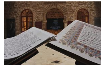
Le Coran et la Torah à l'entrée de Bayit Dakira

Les visiteurs sont accueillis par: « Shalom Aleykoum Salam lekoulam » mêlant arabe et hébreu afin d'illustrer la proximité complice entre Juifs et Musulmans. La responsable culturelle et son assistant vous y accueillent, disponibles pour toute question.