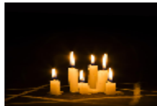
Nos pensées et nos âmes avec leurs âmes

Soirée du Lundi 13 Avril 2026 et Mardi 14 Avril