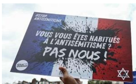
Manifestation contre l'antisémitisme ("Nous Vivrons")