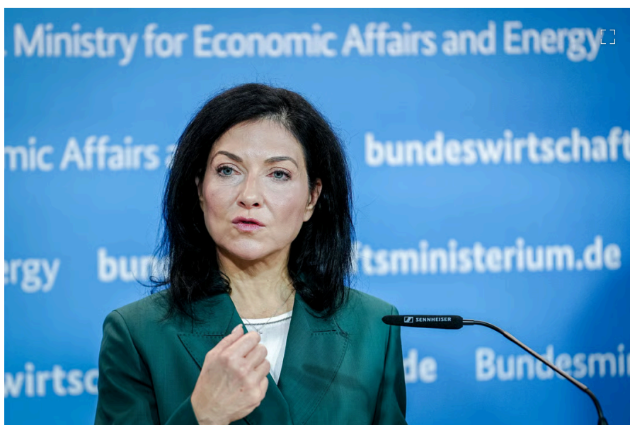
Wirtschafts- und Energieministerin Katherina Reiche: Der von ihr beauftragte Bericht hatte bereits vor der Veröffentlichung für Diskussionen gesorgt.

► Artikel anhören für Abonnenten verfügbar