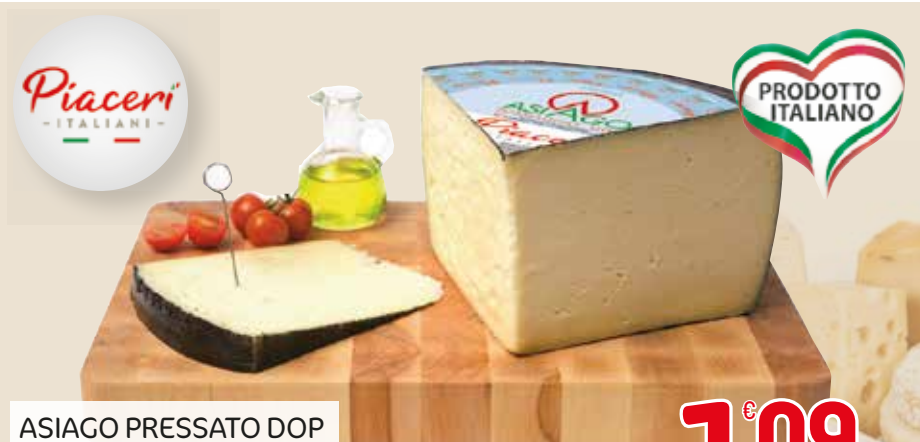
ASIAGO PRESSATO DOP PIACERI ITALIANI L'etto