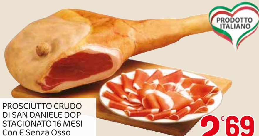
PROSCIUTTO CRUDO DI SAN DANIELE DOP STAGIONATO 16 MESI Con E Senza Osso L'etto