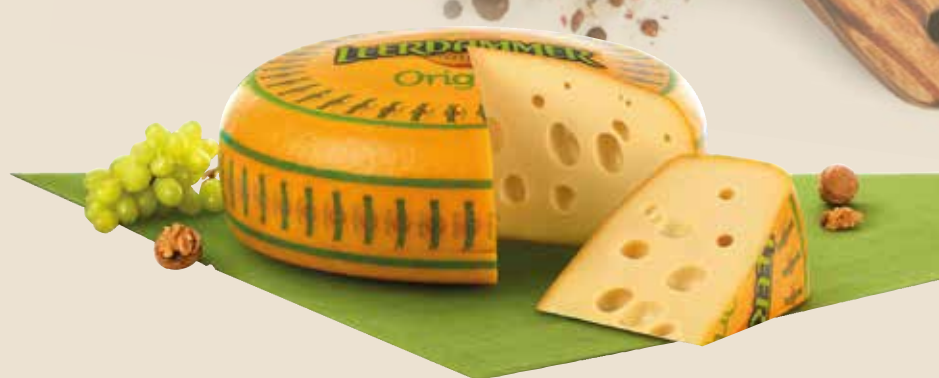
FORMAGGIO LEERDAMMER ORIGINAL L'etto