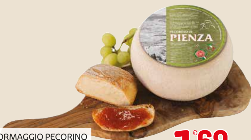
FORMAGGIO PECORINO DI PIENZA L'etto