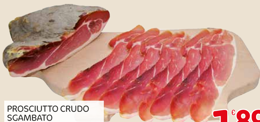
PROSCIUTTO CRUDO SGAMBATO Con E Senza Pepe L'etto