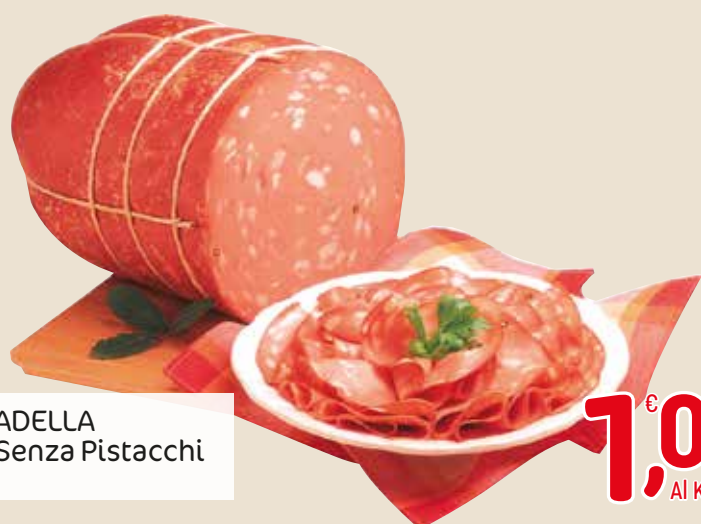
MORTADELLA Con E Senza Pistacchi L'etto