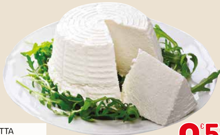
RICOTTA LATTEBUSCHE L'etto