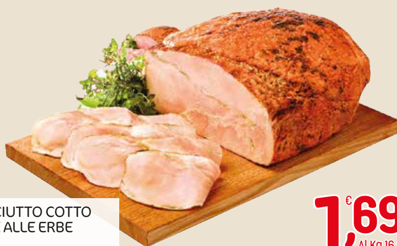
PROSCIUTTO COTTO BRACE ALLE ERBE L'etto