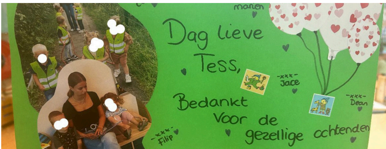
Afbeelding: Kind & Ludens