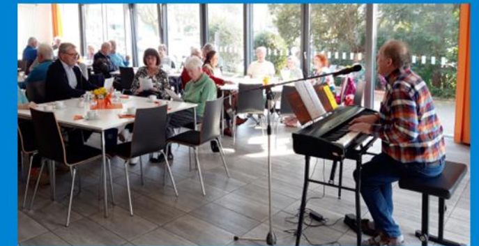
Frühlingssingen mit dem Heimatverein am 20. März 2026

Montags in der Zeit von 19.30 Uhr bis 21.30 Uhr sind Sie im „Treffpunkt“, im Breil 10 herzlich willkommen.