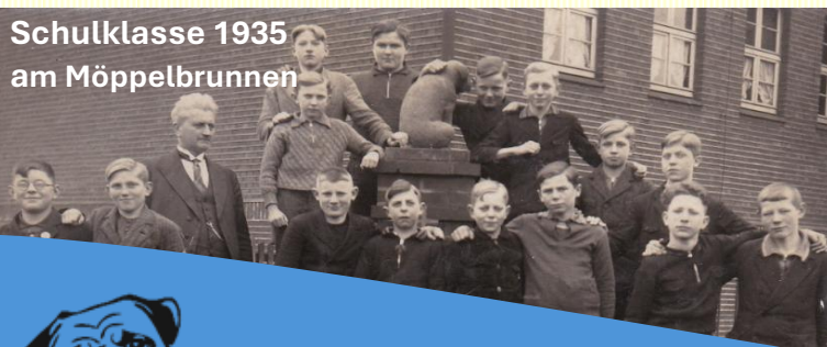
Schulklasse 1935 am Möppelbrunnen

Treffen sich zwei Möppel. Sagt der eine zum anderen: „Mein Herrchen ist so saublöd! Jetzt bringe ich ihm schon zum tausendsten Mal den Ball und er wirft ihn immer wieder weg.“