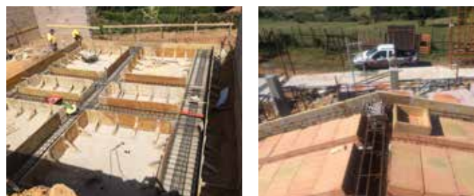
ANNESSE Pineta Marina di Grosseto Realizzazione struttura in cemento armato e tamponatura in laterizio.