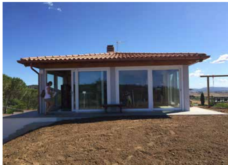
VILLETTA UNIFAMILIARE Castiglione della Pescaia