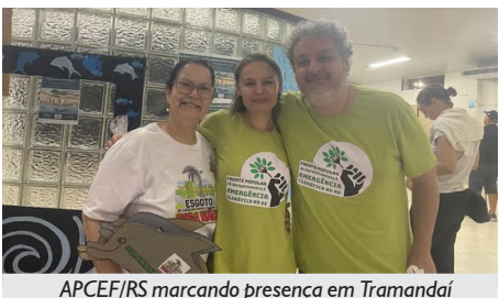
APCEF/RS marcando presença em Tramandaí

Recentemente, o Ministério Público Federal e o Ministério Público Estadual, atendendo a um requerimento do MOVLN, ingressaram com Ação Civil Pública, solicitando que a Justiça Federal anule a licença prévia que autoriza o lançamento de efluentes tratados no curso do Rio Tramandaí, no litoral norte do Rio Grande do Sul. Na ação são corroboradas as reivindicações do MOVLN de mais estudos do impacto do lançamento dos dejetos, da realização de audiências públicas e de um EIA/Rima.