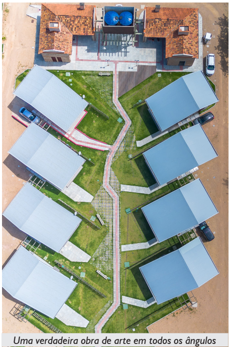
Uma verdadeira obra de arte em todos os ângulos

O Setor de Reservas da APCEF mantém todos(as) informados(as) com publicações nos canais oficiais da Associação, atualizando a respeito de vagas disponíveis, listas de espera e sobre como efetuar as reservas. O contato pode ser feito pelo telefone (51) 3268-1611, ou pelo e-mail reservas@apcefrs.org.br.