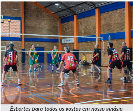
Esportes para todos os gostos em nosso ginásio

que se empenharam na organização do evento, aos colegas das equipes que vieram prestigiar e jogar, e ao Núcleo de Cultura Gaúcha por mais uma vez estar pronto para pôr a mão na massa, ou melhor, na carne”.