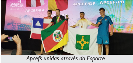
Apcefs unidas através do Esporte

A APCEF/RS parabeniza a todos gaúchos e gaúchas que, após muitos treinos e incansável preparação, se deslocaram até João Pessoa para tão bem representar o nosso estado. Vocês enchem o Rio Grande do Sul de alegria. Muito obrigado!