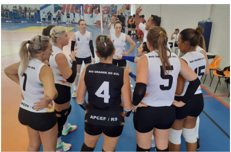
Gaúchas unidas e aguerridas ficaram com a Prata