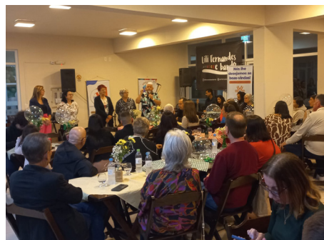
Um dia memorável para a Regional Litoral Norte

prêmios. No domingo, dia 29, teve café da manhã, e ao meio-dia, foi servido um delicioso churrasco de encerramento.