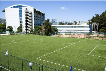
Parque Esportivo da PUC/RS

Já em dezembro de 2024, nossa Associação firmou convênio com o Parque Esportivo da PUC/RS, em Porto Alegre, um dos maiores complexos de esporte, saúde e bem-estar do Brasil. Ele conta com academia e diversas aulas, piscinas, campos e quadras de futebol, quadra de areia, quadras poliesportivas com pisos emborrachados, quadras de tênis e auditório. Os benefícios oferecidos para associados(as) da APCEF/RS e seus dependentes, são os valores