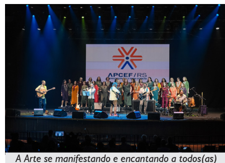
A Arte se manifestando e encantando a todos(as)

consumo de produtos regionais, sendo a música gaúcha um deles.