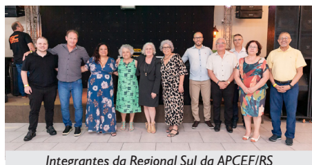
Integrantes da Regional Sul da APCEF/RS

abraços calorosos deram a tônica de uma noite muito especial. Após um delicioso jantar, o embalo adentrou a madrugada, até por volta de 1h30min.