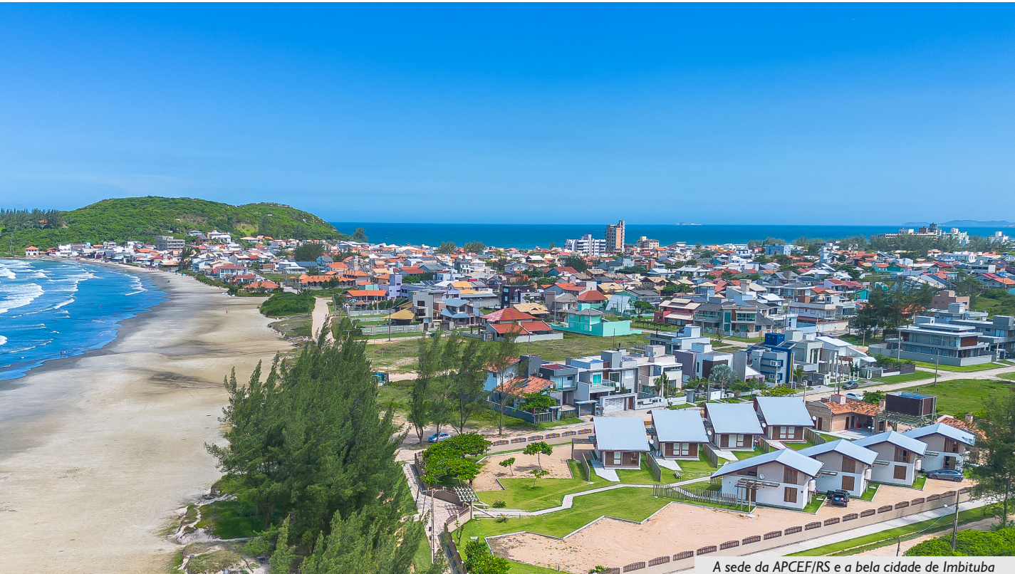
A sede da APCEF/RS e a bela cidade de Imbituba