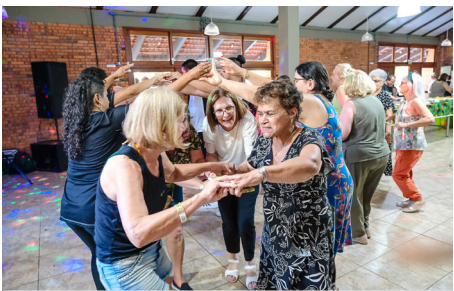
Alegria de sobra na celebração de nossos(as) aposentados(as)

A piscina ficou disponível, teve cabine de fotos, muita música e dançarinos, que aliás,