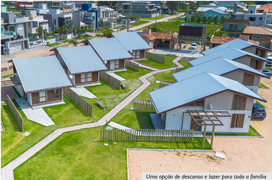
Uma opção de descanso e lazer para toda a família

1990. Resultado de um processo democrático e participativo, a obra foi aprovada em assembleia em 4 de dezembro de 2021, e teve o seu início em 27 de março de 2023. Pouco menos de 1 ano depois, a construção foi entregue, totalmente quitada. Com isso, somos a primeira APCEF do país - e a única - a manter sede em dois estados, Rio Grande do Sul e Santa Catarina.