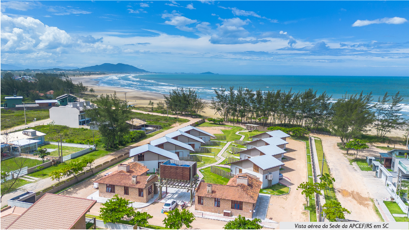
Vista aérea da Sede da APCEF/RS em SC