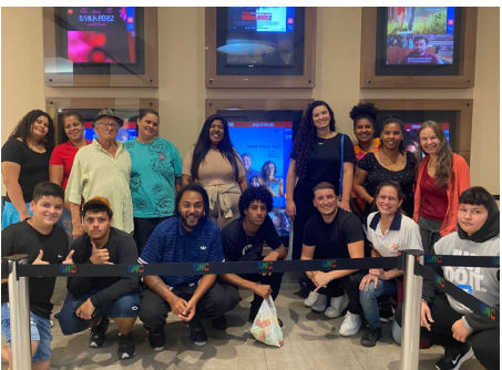
Turma animada para a sessão de cinema

Desde a saída coletiva para o ônibus até a chegada ao cinema, a animação se