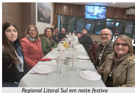
Regional Litoral Sul em noite festiva

Fez bastante frio em Rio Grande na noite de 9 de agosto de 2024, uma sexta-feira, mas nem por isso associadas e associados da APCEF/RS deixaram de prestigiar o Jantar da Regional Litoral Sul. A confraternização também reuniu familiares e amigos, e aconteceu na Galeteria da Nonna, local este que agrada muito a todos(as) pelo cardápio delicioso e pelo bom atendimento.