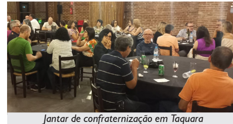
Jantar de confraternização em Taquara

que fazem parte da Regional: Taquara, Igrejinha, Três Coroas, Rolante e Parobé.