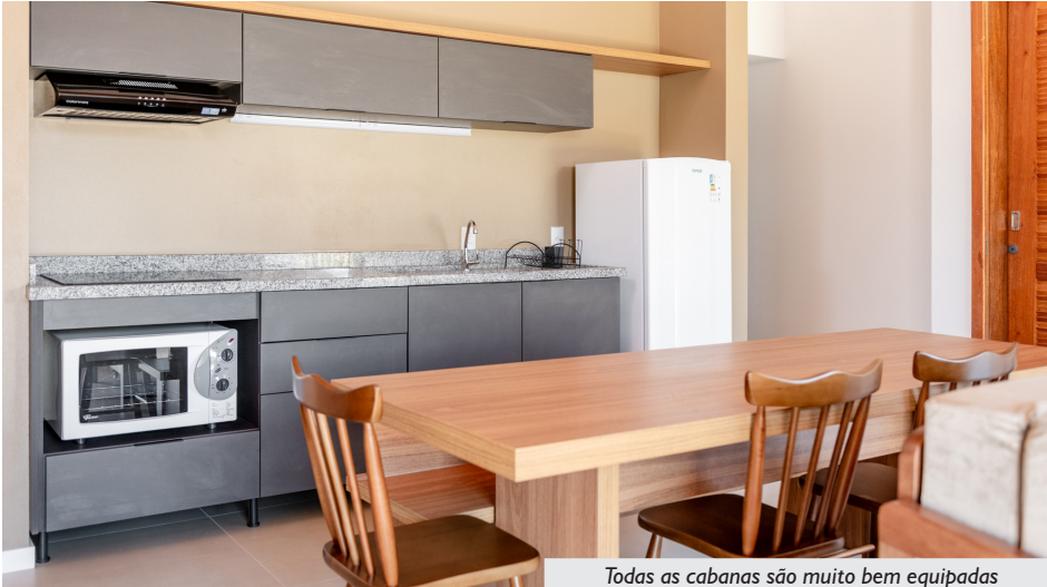
Todas as cabanas são muito bem equipadas