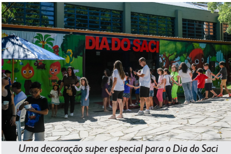
Uma decoração super especial para o Dia do Saci

Uma das novidades na edição deste ano foi o futebol, com partidas disputadas na quadra de areia da APCEF. Envolvendo meninos e meninas, toda a atividade foi supervisionada pelo treinador Douglas Fochesato. Os adultos aproveitaram para botar o papo em dia e tomar um bom mate no Cantinho do Chimarrão. Esse point,