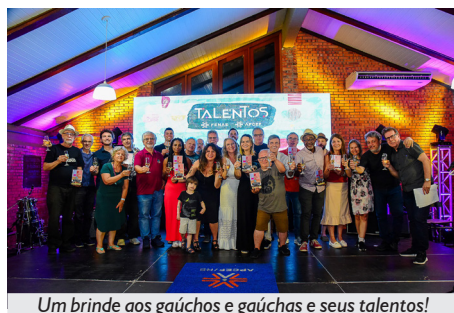
Um brinde aos gaúchos e gaúchas e seus talentos!

A qualidade musical e o nível técnico deram a tônica da seletiva, que terminou com a seguinte classificação: