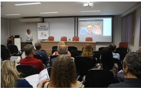
Associados(as) atentos(as) às novidades