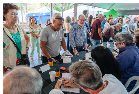
Obras devidamente autografadas na Feira do Livro

obra. Esta foi uma das maiores, se não a maior sessão coletiva de autógrafos nesta edição da Feira.