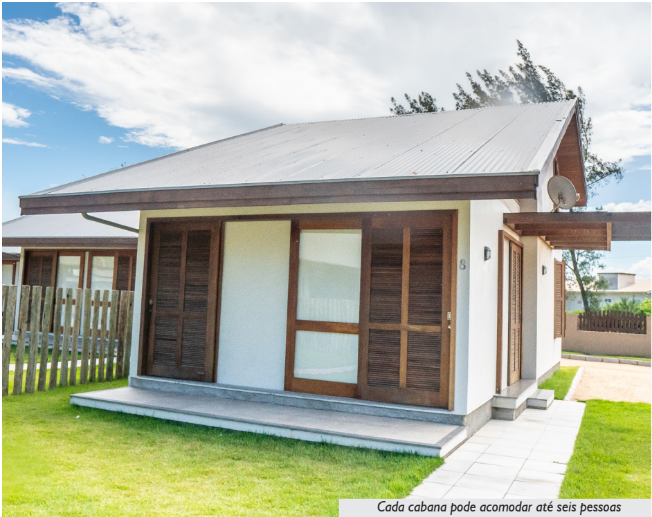
Cada cabana pode acomodar até seis pessoas

A estrutura conta com oito cabanas, com dois dormitórios em cada (acomodação para até 6 pessoas), e uma delas adaptada para receber com todo o conforto pessoas com deficiência. Há também os prédios do Convívio Coletivo, com duas áreas de churrasqueiras,