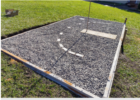
O relógio de sol de São Francisco de Paula

horário de Brasília, devido a diferença de longitude.