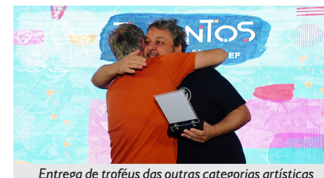
Entrega de troféus das outras categorias artísticas

Fica o nosso reconhecimento e gratidão a todos(as) que se apresentaram, por serem artistas tão talentosos e dedicados, enchendo de orgulho a nossa APCEF/RS.