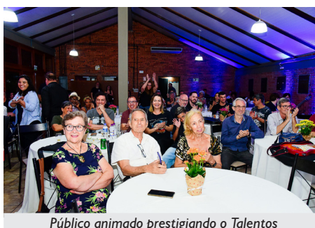
Público animado prestigiando o Talentos