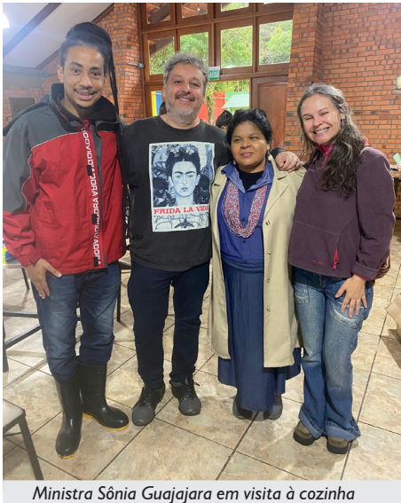
Ministra Sônia Guajajara em visita à cozinha

Foram 37 dias de incansável serviço voluntário, envolvendo empregados e empregadas da APCEF, membros da diretoria, associados e associadas, representantes do Núcleo de Cultura Gaúcha, integrantes da Casa de Cultura e Resistência, além de pessoas da comunidade em geral. No total, foram produzidas e distribuídas gratuitamente