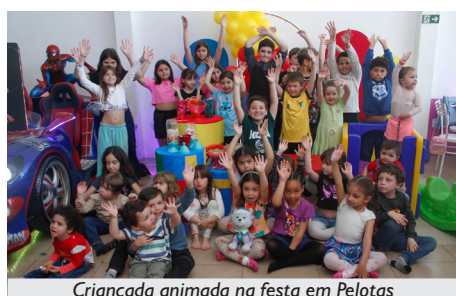
Criançada animada na festa em Pelotas

O dia 12 de outubro de 2024 rendeu boas risadas e momentos inesquecíveis durante a Festa do Dia das Crianças