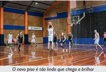
O novo piso é tão lindo que chega a brilhar

Aconteceu no dia 19 de outubro de 2024 a reinauguração do Ginásio de Esportes da APCEF/RS, em Porto Alegre. Ele estava fechado desde setembro para que fosse feita a reforma do piso.