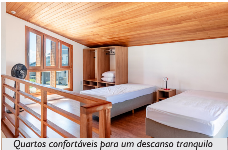
Quartos confortáveis para um descanso tranquilo