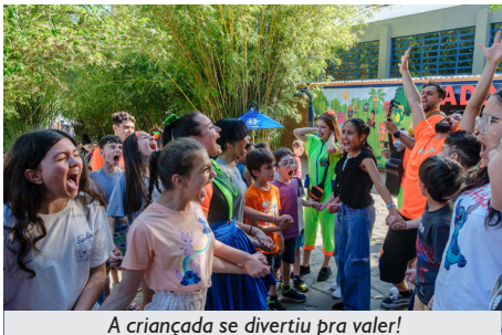
A criançada se divertiu pra valer!