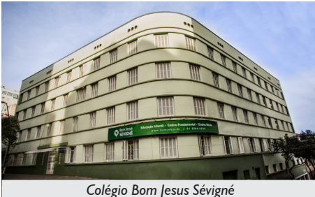
Colégio Bom Jesus Sévigné

associados(as) que se matricularem na Educação Básica, abrangendo desde a Educação Infantil Creche até a 3ª série do Ensino Médio.