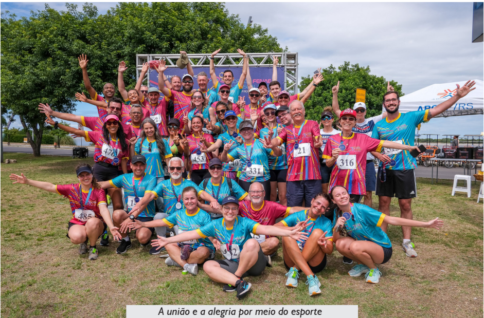
A união e a alegria por meio do esporte