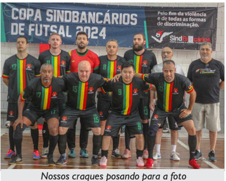
Nossos craques posando para a foto

Um fato interessante: no dia 23 de novembro, perdemos a semifinal para o União, sendo esta a primeira e única derrota da equipe, depois de 15 meses de trabalho.