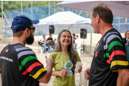
Diretoria da APCEF/RS feliz da vida com a reinauguração