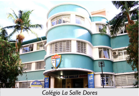
Colégio La Salle Dolores

A APCEF/RS firmou, em agosto de 2024, convênio com o Colégio La Salle Dolores, de Porto Alegre. Com 116 anos de tradição na formação de cidadãos e cidadãs, o colégio é reconhecido por seu ensino de excelência, pautado pelos valores Lassalistas. A parceria estabelece um desconto de 10% nas mensalidades escolares para os filhos e filhas dos