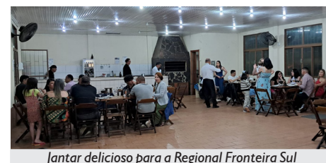
Jantar delicioso para a Regional Fronteira Sul

A confraternização da Regional Fronteira Sul da APCEF/RS foi à altura das conquistas de 2024, motivando a todos(as) para que 2025 seja um ano ainda melhor.