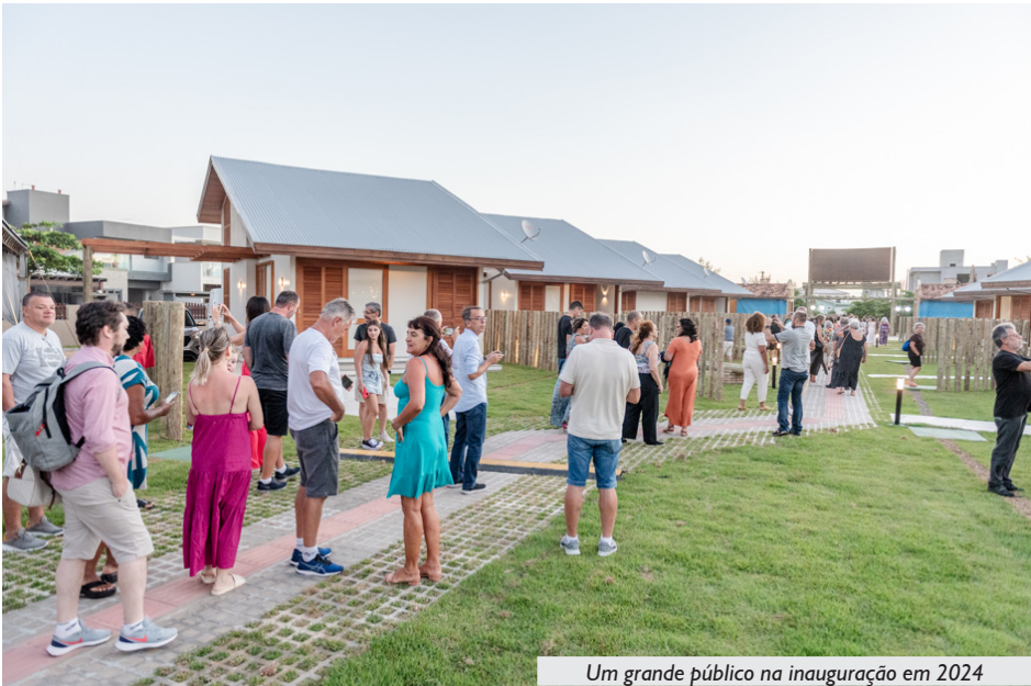
Um grande público na inauguração em 2024