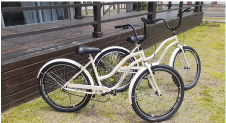
Bicicletas para associados(as) em Tramandaí

Sempre pensando no bem estar de seus associados e associadas, a APCEF/RS inovou no Espaço Bem Viver Tramandaí. Desde janeiro de 2024, duas bicicletas ficam à disposição de quem lá se hospedar.