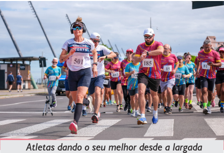
Atletas dando o seu melhor desde a largada

O dia 23 de novembro de 2024 foi mais uma daquelas datas para se guardar na memória com muito carinho, por todos(as) que participaram da 14ª Corrida Fenae/Apcef do Pessoal da Caixa. O dia estava maravilhoso, com o tempo agradável, sendo uma motivação a mais aos corredores e corredoras.