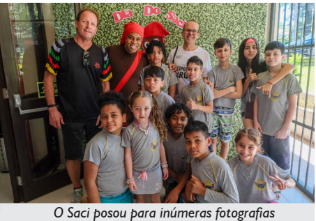
O Saci posou para inúmeras fotografias

O Espaço Bem Viver da APCEF em Porto Alegre recebeu centenas de crianças e seus familiares na tarde do dia 20 de outubro de 2024, um domingo de muito sol e calor. Na ocasião, foi realizada a 15ª edição do Dia do Saci, com apoio da Fenae, evento bastante aguardado a cada ano.