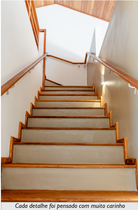
Cada detalhe foi pensado com muito carinho