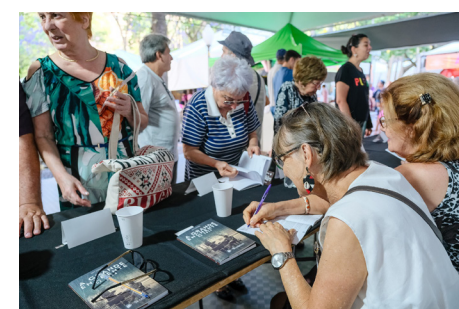
Autoras e leitoras interagindo na sessão de autógrafos