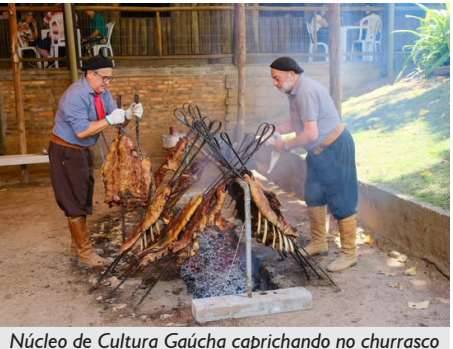
Núcleo de Cultura Gaúcha caprichando no churrasco

O dia 24 de novembro de 2024 foi um daqueles domingos que entraram para a história da nossa querida Associação. Com todos os ingressos vendidos antecipadamente, não poderia ter sido diferente: o XIV Costelão da APCEF foi um sucesso!