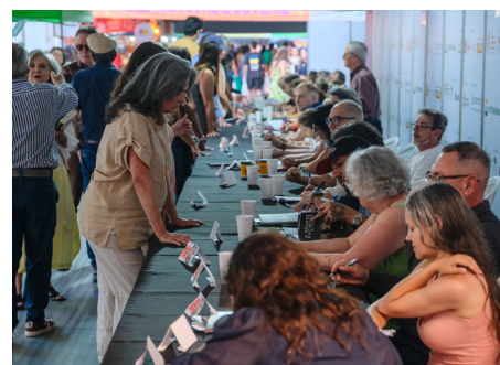
Autores e autoras em contato com o público

Composto por contos e poesias, o livro traz como perspectiva os sentimentos e as múltiplas visões sobre os acontecimentos na maior calamidade climática que assolou o Rio Grande do Sul. Nas diversas narrativas, evidencia-se a importância da solidariedade e do coletivo. Além de um importante registro histórico, a obra constitui-se em uma reflexão sobre a urgência de uma mudança de paradigma, pois catástrofes desta magnitude são consequências de um sistema sustentado pela exploração e degradação da Natureza, o qual mostra-se a cada dia mais insustentável.