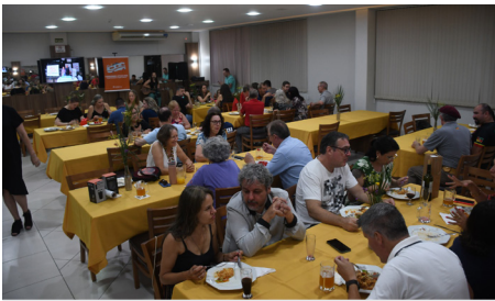
Jantar, música ao vivo e boas conversas

O projeto começou suas atividades em dezembro de 2022, em Santo Ângelo. Depois, esteve em Passo Fundo, em janeiro de 2023. Já em março do mesmo ano, visitou Caxias do Sul e Farroupilha. Em setembro, ainda em 2023, foi a vez