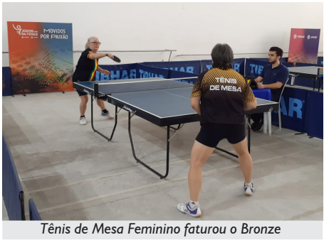
Tênis de Mesa Feminino faturou o Bronze

No último dia de competição, as gaúchas ficaram com a medalha de prata no Vôlei Feminino, perdendo a final para Minas Gerais. Além disso, tivemos a entrega do troféu e medalhas para os gaúchos, que sagraram-se campeões no Futsal Masculino, vencendo no dia anterior o time do Distrito Federal por 4 a 1.