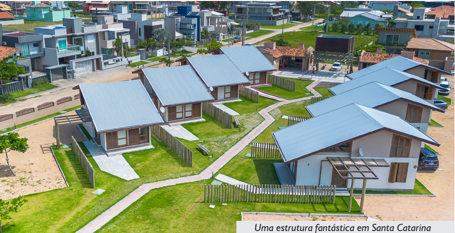
Uma estrutura fantástica em Santa Catarina

Não conheces ainda o Espaço Bem Viver Itapirubá? Vem conosco, usufruir e valorizar mais essa conquista coletiva da família APCEF/RS!