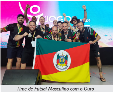
Time de Futsal Masculino com o Ouro

A delegação gaúcha, composta por 95 pessoas, trilhou um caminho de muito suor, emoções, disputas acirradas, vitórias memoráveis, além é claro, do principal de tudo: momentos que ficarão para sempre no coração de cada atleta participante, medalhista ou não.