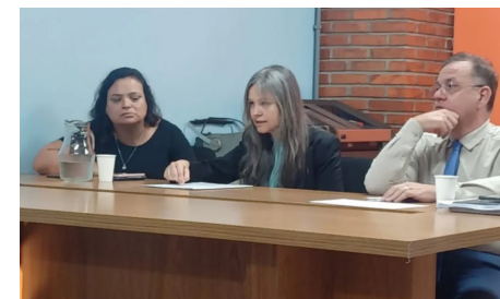
Diretoria e Setor Jurídico da APCEF/RS na Assembleia

térmico de papéis utilizados em bobinas de caixa. Durante o manuseio constante, como ocorre com caixas e tesoureiros, o bisfenol é facilmente absorvido pela pele. Estudos