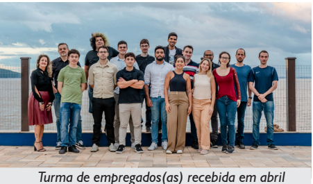
Turma de empregados(as) recebida em abril

Sempre acolhedora e pronta para receber a todos(as) de braços abertos, a APCEF/RS realizou, em 2025, dois eventos de recepção de novos empregados e empregadas da Caixa, admitidos em concursos públicos para a instituição. Os encontros ocorreram em dois momentos do ano, ambos no Galpão Crioulo da Associação em Porto Alegre.