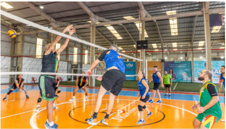
Energia, disposição e belas jogadas no voleibol