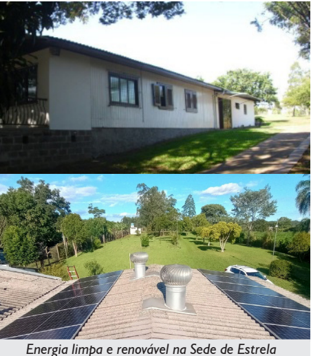
Energia limpa e renovável na Sede de Estrela

A Sede de Estrela, no Vale do Taquari, passou a contar com placas solares fotovoltaicas, reforçando o compromisso ambiental da Associação. A estrutura inclui piscina, campo de futebol iluminado, salão de festas e cancha de bocha.