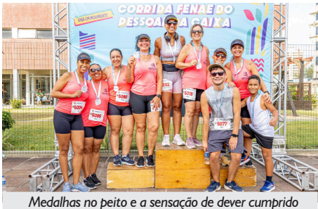
Medalhas no peito e a sensação de dever cumprido

A competição foi maravilhosa. Parabéns a todos(as)!