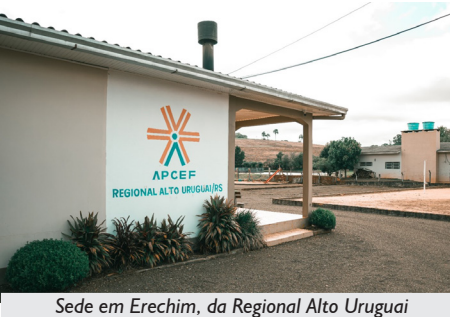
Sede em Erechim, da Regional Alto Uruguai

Você pode obter mais informações sobre os Espaços Bem Viver e as Sedes da APCEF/RS entrando em contato com o Setor de Reservas da Associação, pelo telefone (51) 3268-1611, ou pelos e-mails reservas@apcefrs.org.br e reservas2@apcefrs.org.br.