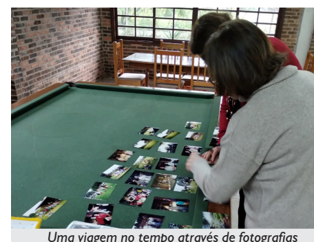
Uma viagem no tempo através de fotografias