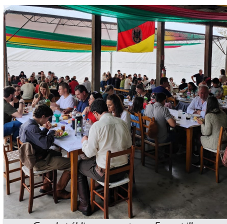
Grande público no evento em Farroupilha

A Sede da APCEF/RS em Farroupilha, toda decorada com as cores da bandeira do Rio Grande do Sul, foi palco do Costelão da Regional Serra, no dia 20 de setembro. Entre associados(as) e familiares, o evento contou com um público de cerca de 130 pessoas, com participação de grande número de aposentados e aposentadas.