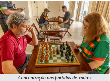
Concentração nas partidas de xadrez

No sábado, 29, ocorreram as partidas de Futebol Society Livre, Futebol Society Master e Vôlei Misto de Quadra, no JR Centro Esportivo. Já as modalidades de Canastra, Truco, Dominó, Xadrez e Damas tiveram como sede o Espaço Bem Viver Tramandaí.