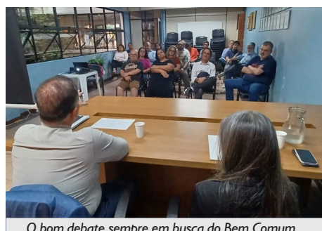
O bom debate sempre em busca do Bem Comum

A primeira, autorizou o ajuizamento - o qual já ocorreu - de Ação Civil Pública de natureza trabalhista contra a Caixa Econômica Federal, que pleiteia o direito dos(as) empregados(as) quanto às