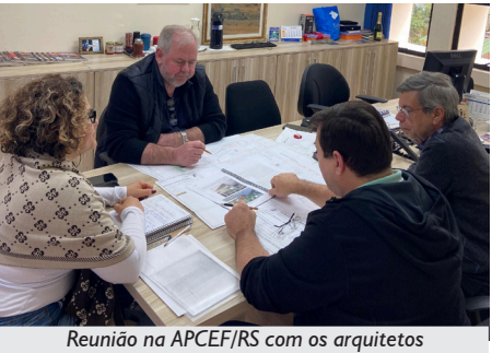
Reunião na APCEF/RS com os arquitetos

Ele engloba um novo apartamento com acessibilidade, vagas especiais dentro da sede, sinalização tátil para deficientes visuais nas áreas internas e externas, acesso à recepção, ao ginásio, ao salão de festas grande, à piscina, entre outros mais.