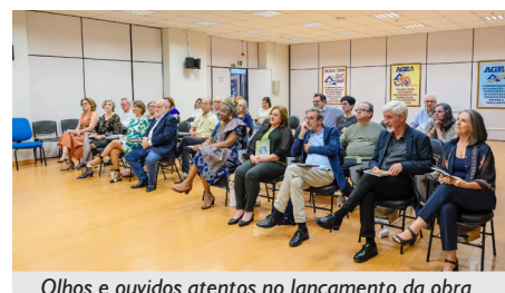
Olhos e ouvidos atentos no lançamento da obra