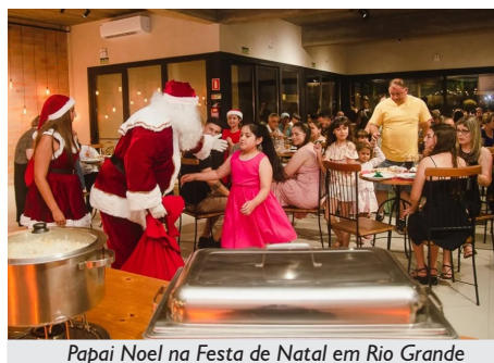
Papai Noel na Festa de Natal em Rio Grande

No dia 19 de setembro, ocorreu o Jantar da Regional Litoral Sul da APCEF/RS, em Rio Grande. Em uma animada noite, cerca de 50 associados(as) e familiares confraternizaram nas dependências do Don Manoel Bistrô, onde foi servida uma sequência de risotos.