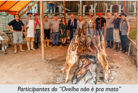
Participantes do “Ovelha não é pra mato”

No dia 13 de abril, aconteceu o “Ovelha não é pra mato”, no Galpão Crioulo da APCEF em Porto Alegre. O evento, promovido pelo Núcleo, reuniu um grande público, com todos ingressos sendo vendidos antecipadamente.