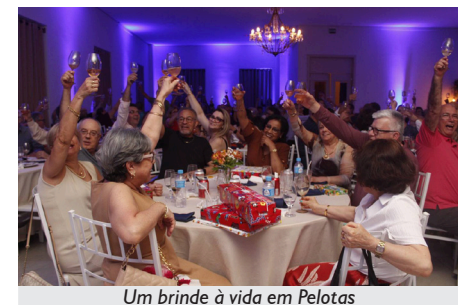
Um brinde à vida em Pelotas

A Regional Sul da APCEF/RS promoveu vários cafés super animados em 2025, culminando com sua tradicional Festa de Final de Ano. Ela foi realizada no dia 5 de dezembro, e reuniu aproximadamente 180 pessoas, entre associados(as), dependentes e convidados(as).