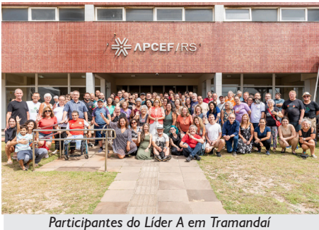
Participantes do Líder A em Tramandaí

Também aconteceram debates enriquecedores, como a apresentação