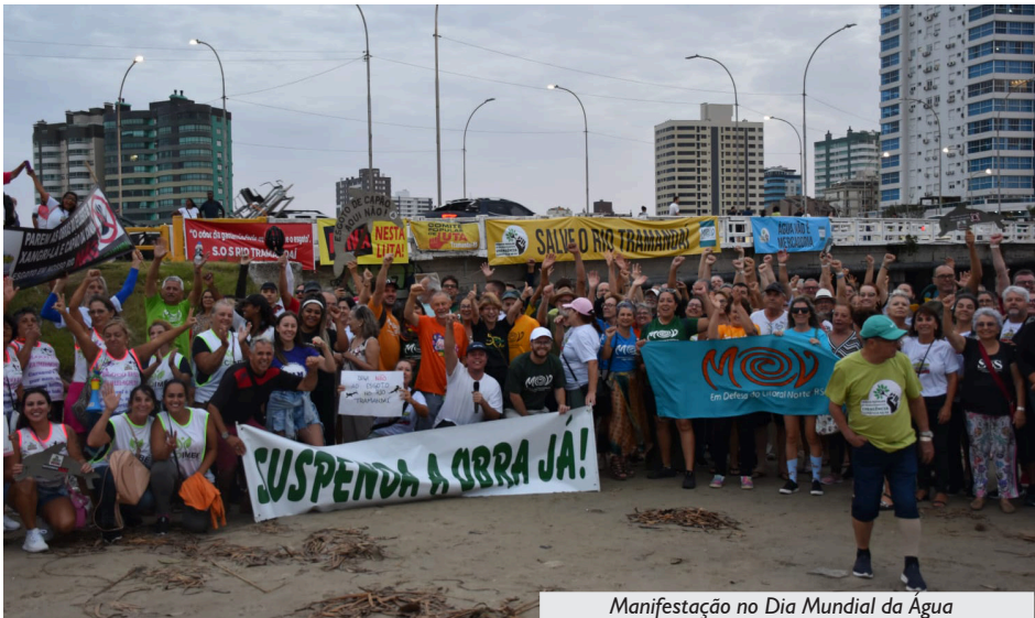
Manifestação no Dia Mundial da Água

A delegação da APCEF/RS, com mais de 70 associados(as), juntou-se a outras entidades do litoral norte e de Porto Alegre,