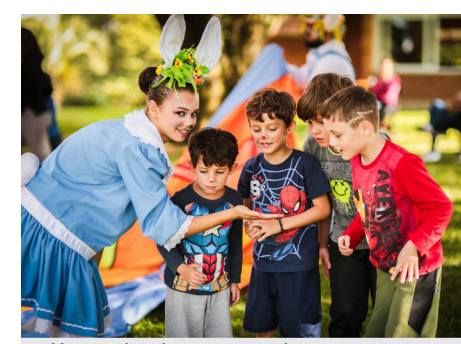
Um mundo mágico e encantador para os pequenos

camarim com pintura facial e oficina de slime.