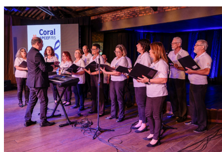
Apresentação do Coral sempre com muita emoção