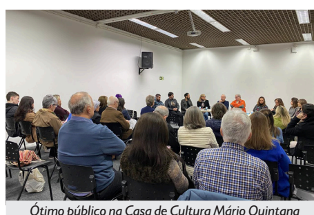
Ótimo público na Casa de Cultura Mário Quintana