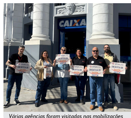
Várias agências foram visitadas nas mobilizações

O banco e a representação dos trabalhadores definiram que, ao longo de 2026, serão debatidas medidas estruturantes para garantir sustentabilidade e qualificação do plano, incluindo mesa permanente de negociação, com retomada já prevista para fevereiro.