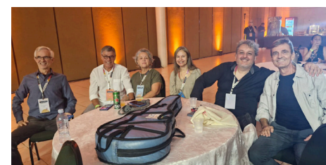
Direção da APCEF/RS e artistas gaúchos em Foz