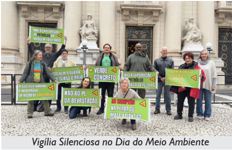
Vigília Silenciosa no Dia do Meio Ambiente

Além da APCEF/RS, estiveram representadas a Associação Gaúcha de Proteção ao Ambiente Natural (AGAPAN), a Associação Mães e Pais pela Democracia (AMPD), o Movimento Laudato Si, o Instituto Mira-Serra, o Coletivo Ser Ação - Ativismo Ambiental, a Frente Popular de Enfrentamento à Emergência Climática no RS, e o Movimento em Defesa do Litoral Norte Gaúcho (MOV).