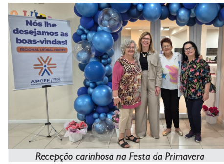
Recepção carinhosa na Festa da Primavera