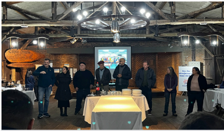
Integrantes da APCEF/RS dando as boas vindas em julho

No dia 3 de abril, foi recebida a primeira turma do ano, e no dia 17 de julho, a segunda. Integrantes da equipe e da Diretoria da APCEF/RS participaram desses momentos tão