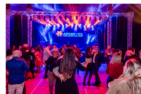
Baile super animado na festa da Associação

Sindicato dos Bancários de Santa Cruz do Sul e Região; Sindicato dos Bancários de Santa Maria e Região; Federação dos Trabalhadores e Trabalhadoras em Instituições Financeiras do Rio Grande do Sul (FETRAFI); Associação dos Gestores da Caixa Econômica Federal do Rio Grande do Sul (AGECEF); Associação Gaúcha de Economistas Aposentados (AGEA); Associação Nacional dos Avaliadores de Penhor (ANACEF);