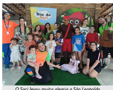
O Saci levou muita alegria a São Leopoldo