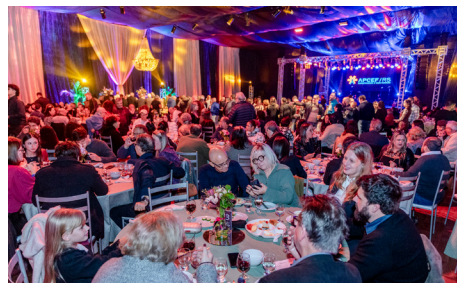
Grande público prestigiou a festa de 72 anos