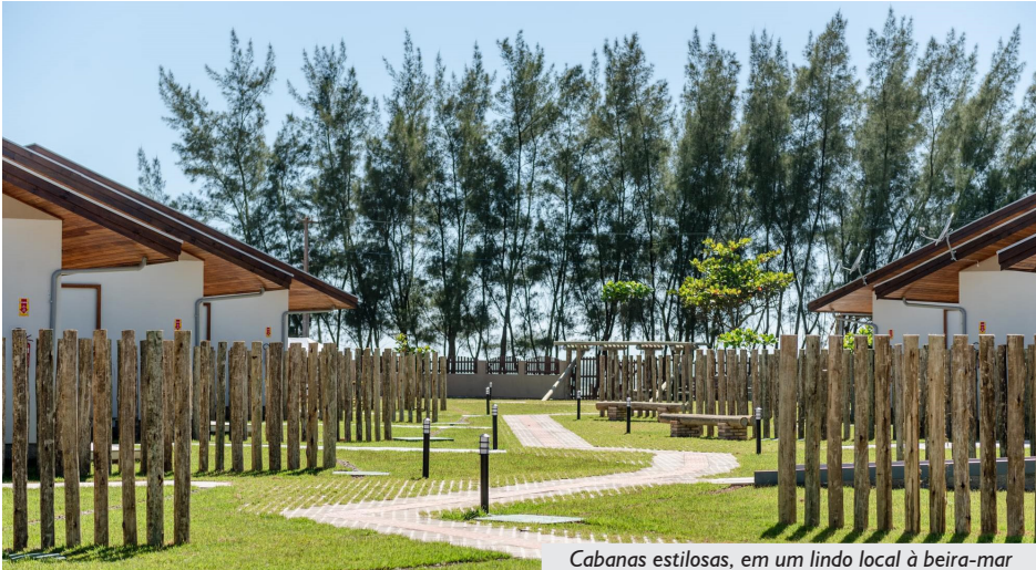
Cabanas estilosas, em um lindo local à beira-mar

Itapirubá é procurada durante todo o ano por praticantes de surfe, kitesurfe, pesca e trilhas, reforçando o caráter atemporal do turismo local. Quem ainda não foi, não vê a hora de visitar pela primeira vez, quem já foi, não vê a hora de voltar.