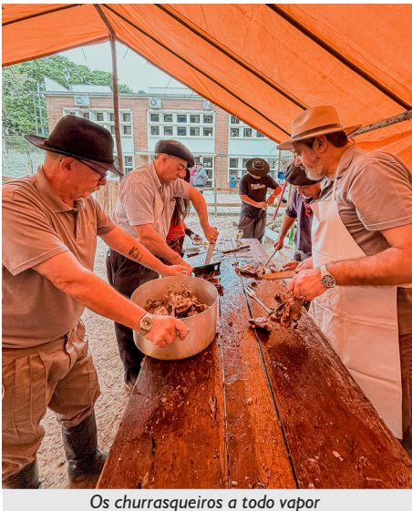
Os churrasqueiros a todo vapor