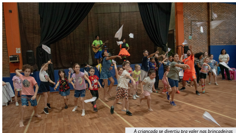
A criançada se divertiu pra valer nas brincadeiras