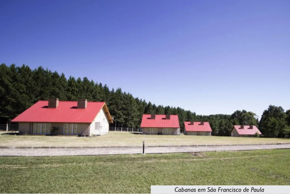
Cabanas em São Francisco de Paula

Localizado nos Campos de Cima da Serra, a pouco mais de 100 km de Porto Alegre, o Espaço Bem Viver São Francisco de Paula está inserido em uma área privilegiada, cercada pela natureza e próxima de importantes atrativos turísticos, como parques de cachoeiras, barragens, trilhas ecológicas e a Floresta Nacional de São Francisco de Paula. A região também permite fácil acesso a destinos como Canela, Gramado, Três Coroas e Cambará do Sul.