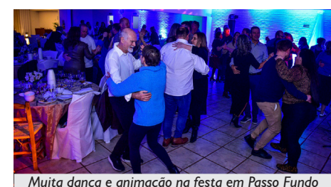
Muita dança e animação na festa em Passo Fundo

APCEF, construímos coletivamente e as ações se amplificam, oportunizando momentos especiais como este, de comemoração, encontros e partilhas”. A seguir, ela manifestou os agradecimentos à Regional e à Fenae e convidou o público para cantar os parabéns e brindar. Quem