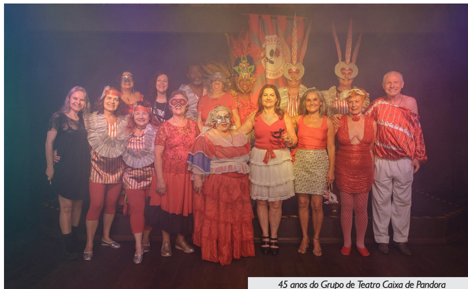
45 anos do Grupo de Teatro Caixa de Pandora

A noite festiva contou com a exibição de dois vídeos especiais: um alusivo aos 20 anos do Núcleo de Cultura Gaúcha e outro aos 45 anos do Grupo de Teatro Caixa de Pandora. O público pôde embarcar junto em uma viagem pelo tempo, e reviver momentos marcantes na trajetória desses dois coletivos tão emblemáticos da APCEF.