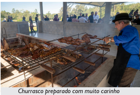
Churrasco preparado com muito carinho