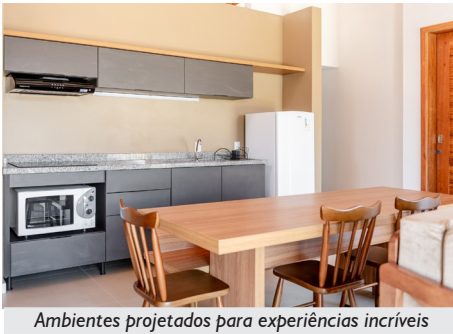
Ambientes projetados para experiências incríveis

princípios socioambientais, o espaço reúne conforto, integração com a natureza e eficiência energética. São oito cabanas, com dois dormitórios cada, acomodando até seis pessoas, sendo uma