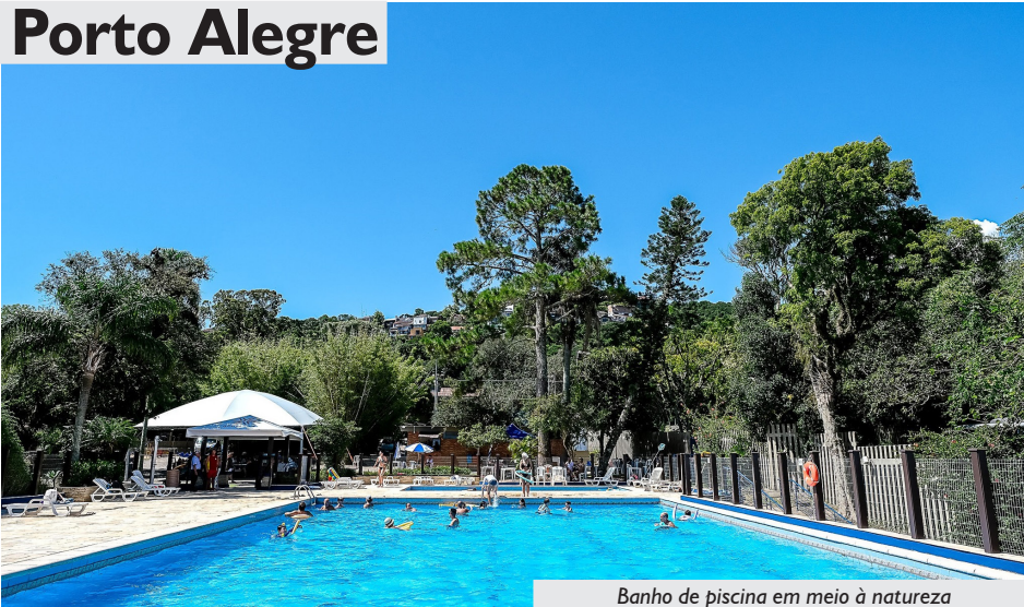
Banho de piscina em meio à natureza

O Espaço Bem Viver Porto Alegre oferece uma opção de lazer e hospedagem na capital, em um ambiente que combina conforto e convivência. São oito apartamentos, com capacidade para até seis ou três pessoas, equipados com televisor, geladeira, ar-condicionado e acesso a mini cozinha coletiva.