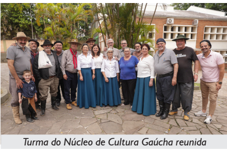
Turma do Núcleo de Cultura Gaúcha reunida

Um evento super tradicional da APCEF/RS foi um grande sucesso em 2025. No dia 26 de outubro, o Galpão Crioulo da sede em Porto Alegre foi palco do XV Costelão da APCEF.