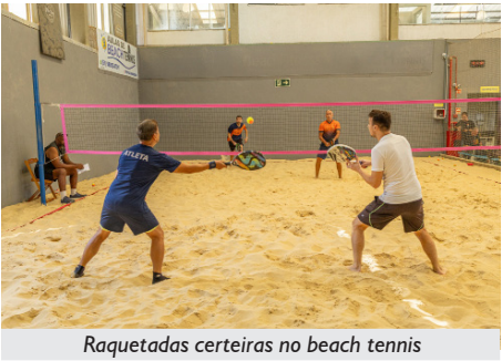
Raquetadas certas no beach tennis

No domingo, para começar o dia, foi servido um café da manhã em nossa sede, e depois as emoções esportivas continuaram nas areias da Arena Sun Beach, com as disputas de Vôlei Fem. e Masc. de Praia, Futevôlei Fem. e Masc., Beach Tennis