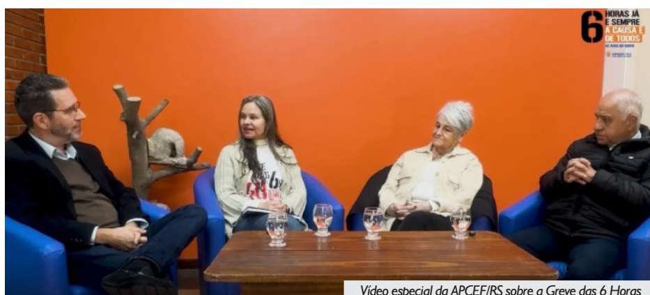
Vídeo especial da APCEF/RS sobre a Greve das 6 Horas

A APCEF/RS teve papel fundamental nessa conquista, o que pode ser conferido no vídeo, gravado com grandes lideranças que protagonizaram este movimento, contando sobre a história, a memória, e resgatando essa luta.