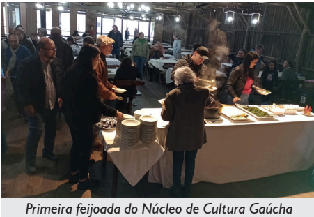
Primeira feijoada do Núcleo de Cultura Gaúcha

O Núcleo de Cultura Gaúcha da APCEF/RS realizou no dia 27 de julho, a primeira edição de sua Feijoada. O evento, que ocorreu no Galpão Crioulo da Associação, foi um sucesso, e assim como no “Ovelha”, os ingressos se esgotaram com antecedência.