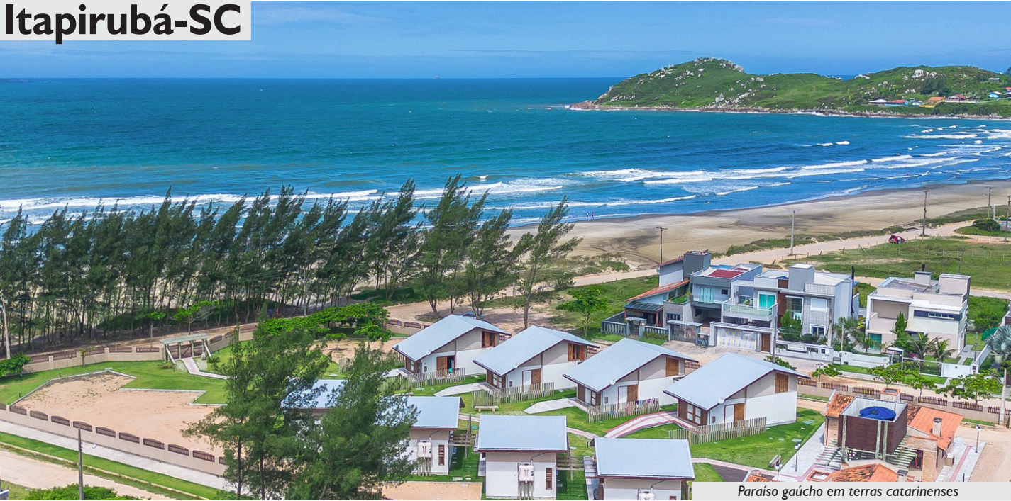
Paraíso gaúcho em terras catarinenses

Inaugurado em março de 2024, o Espaço Bem Viver Itapirubá, em Imbituba, Santa Catarina, representa um marco histórico para a APCEF/RS. Fruto de um sonho coletivo, aprovado em assembleia e construído a partir de