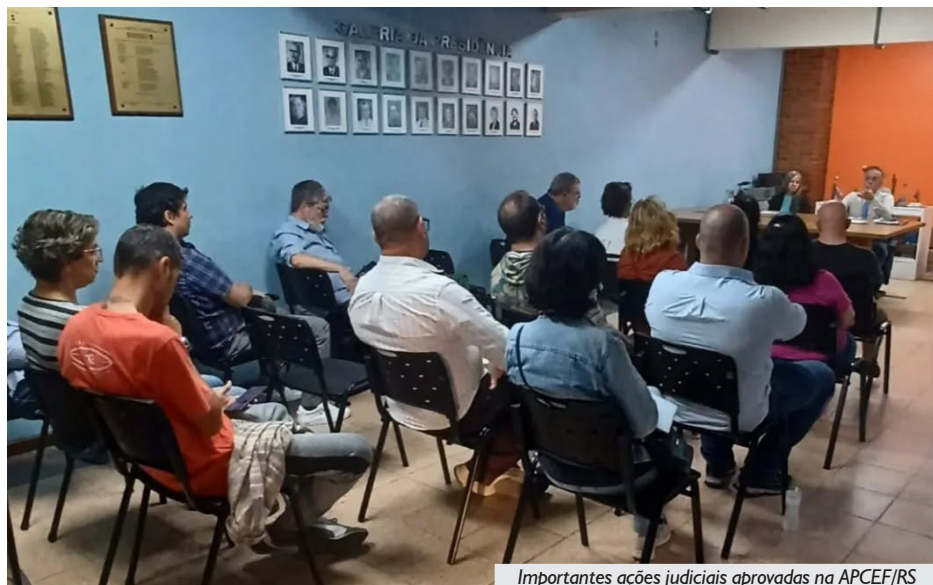
Importantes ações judiciais aprovadas na APCEF/RS

diferenças salariais advindas do Adicional de Insalubridade em razão do contato e da exposição ao produto químico bisfenol - substância presente no revestimento