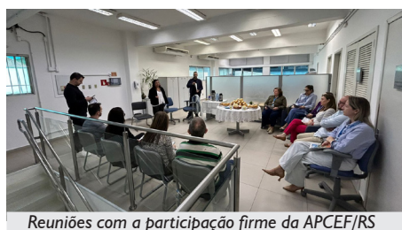
Reuniões com a participação firme da APCEF/RS

a participação atual (3,5% sobre o salário do titular e até R$ 480,00 por dependente). Esse resultado evita o repasse dos crescentes custos médicos e assistenciais ao bolso dos usuários em um contexto de forte inflação médica no país.