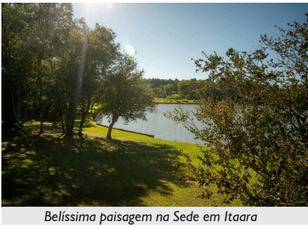
Belíssima paisagem na Sede em Itaara

Todos os Espaços Bem Viver e Sedes da APCEF/RS compartilham um mesmo propósito: oferecer ambientes acolhedores, acessíveis e integrados à natureza, onde associados(as) e suas famílias possam viver momentos de descanso, lazer e convivência, em qualquer época do ano. Porque viver bem é estar junto, cuidar das pessoas e construir, coletivamente, um futuro melhor.