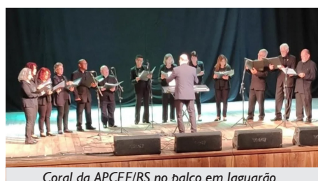
Coral da APCEF/RS no palco em Jaguarão