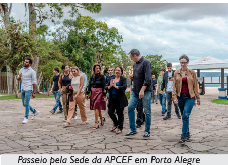
Passeio pela Sede da APCEF em Porto Alegre

A APCEF/RS deseja, em cada nova recepção, muito sucesso aos empregados e empregadas da Caixa, e é claro, já está no aguardo de novas turmas em 2026.