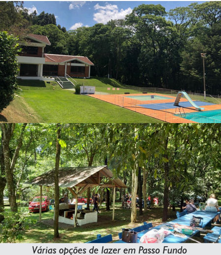
Várias opções de lazer em Passo Fundo

Já a Sede de Passo Fundo oferece piscina, campo de futebol sete, áreas com churrasqueiras, salão de festas, sala de jogos e quadra de vôlei, atendendo associados e associadas da região durante todo o ano.