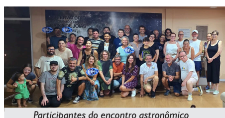
Participantes do encontro astronômico