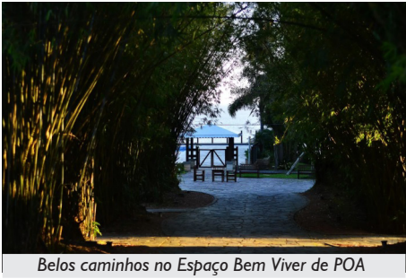
Belos caminhos no Espaço Bem Viver de POA

Um espaço pensado para encontros familiares, confraternizações entre amigos(as) e momentos de descanso sem sair da cidade.