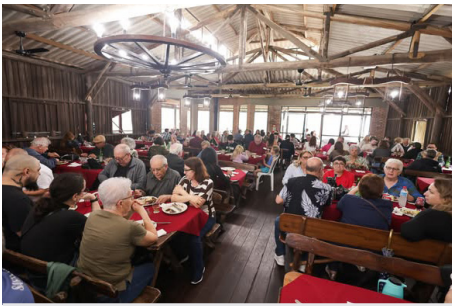
XV Costelão da APCEF com um ótimo público

O encontro festivo reuniu cerca de 200 pessoas, vindas de Cachoeirinha, Canoas, Frederico Westphalen, Nova Petrópolis, Nova Prata, Novo Hamburgo,