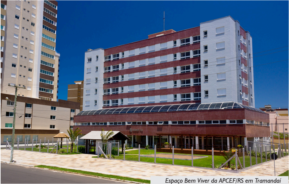
Espaço Bem Viver da APCEF/RS em Tramandaí

A estrutura inclui estacionamento coberto, recepção, área de convivência, churrasqueira, salão de festas, sala de jogos, sala de TV e dois elevadores. Na área externa, os associados e associadas encontram deck pergolado, mini-quadra esportiva, jardim, quiosque e parque infantil, tornando o espaço ideal para as famílias aproveitarem durante todo o ano, e não apenas na alta temporada de verão.