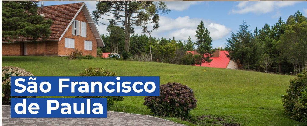
São Francisco de Paula