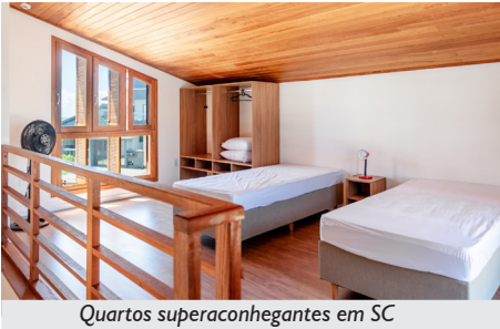
Quartos superaconhegantes em SC

Inaugurado em março de 2024, o Espaço Bem Viver Itapirubá, em Imbituba, Santa Catarina, representa um marco histórico para a APCEF/RS. Fruto de um sonho coletivo, aprovado em assembleia e construído a partir de