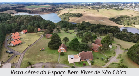
Vista aérea do Espaço Bem Viver de São Chico

Entre os diferenciais estão a trilha ecológica e o observatório astronômico-didático, reforçando a proposta de integração com a natureza e experiências que vão além do descanso.