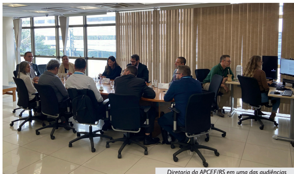
Diretoria da APCEF/RS em uma das audiências

Graças à firme atuação da entidade, a Caixa teve de incluir seis novos itens de segurança para implementação nas