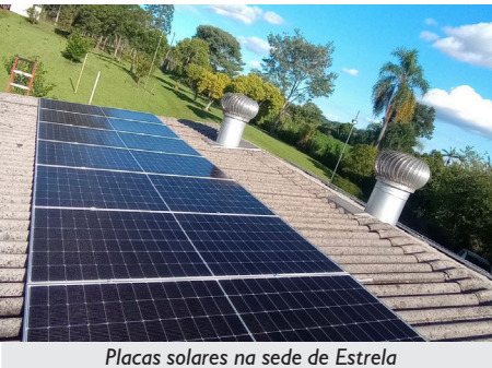
Placas solares na sede de Estrela

A APCEF/RS, atenta e comprometida com o meio ambiente, apresentou em abril deste ano uma novidade na Regional Vale do Taquari. A Coordenação da Regional instalou placas solares fotovoltaicas, que transformam a luz do sol em energia elétrica, na sede de Estrela.