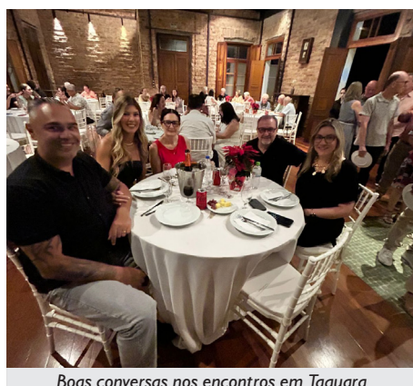
Boas conversas nos encontros em Taquara