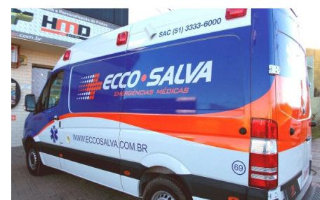
Ambulância da Ecco Salva

A Ecco Salva possui uma frota mista de veículos para emergências e urgências, incluindo ambulâncias, carros e motos. Ela fica localizada na Av. Cristóvão Colombo, 832, no Bairro Floresta, em Porto Alegre. O telefone de contato é o (51) 3333-6000.