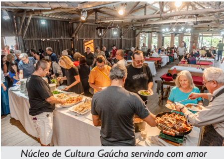
Núcleo de Cultura Gaúcha servindo com amor

Antes do almoço teve a mateada, para depois ser servido o prato principal, a tradicional ovelha assada na vala, com salada litorânea e acompanhamentos.