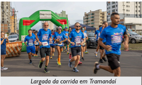
Largada da corrida em Tramandaí