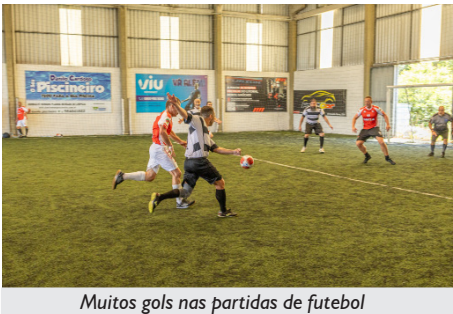
Muitos gols nas partidas de futebol

Fem., Masc. e Misto. As medalhas dessas modalidades foram entregues após as disputas, na própria Arena.