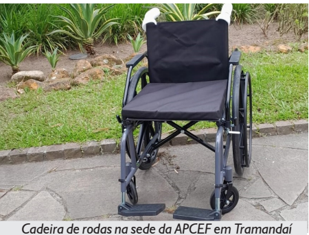
Cadeira de rodas na sede da APCEF em Tramandaí

E assim continuam os trabalhos da APCEF/RS, sempre em busca de oferecer maior comodidade em suas dependências.