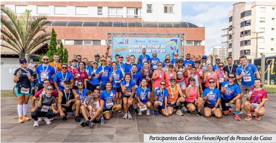
Participantes da Corrida Fena/Apcef do Pessoal da Caixa