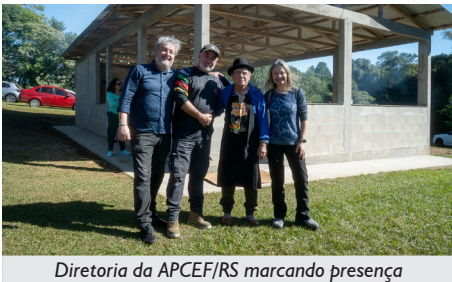
Diretoria da APCEF/RS marcando presença