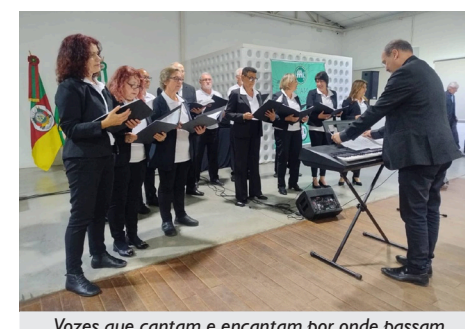
Voices que cantam e encantam por onde passam

grupo fez uma maravilhosa apresentação! Convido você, associado(a) da APCEF, na ativa ou aposentado(a), a experimentar fazer umas aulas no coral, e quem sabe gostar e aprender a cantar. Estou muito feliz de fazer parte desse baita grupo, e é claro, de fazer parte da APCEF”.