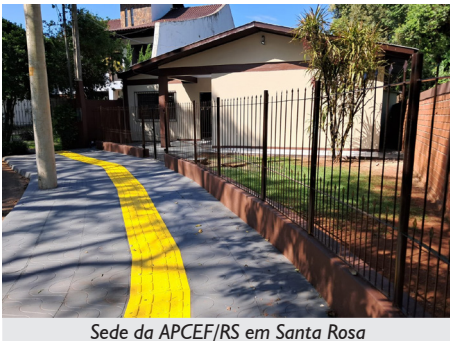
Sede da APCEF/RS em Santa Rosa

Além desses belos locais já mencionados, a APCEF/RS conta com outras lindas e acolhedoras sedes espalhadas pelo Rio Grande do Sul, nas cidades de Bagé, Cachoeira do Sul, Erechim, Farroupilha, Frederico Westphalen, Ijuí, Itaara, Palmeira das Missões, Santa Rosa, Santo Ângelo e São Leopoldo.