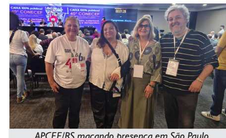
APCEF/RS marcando presença em São Paulo