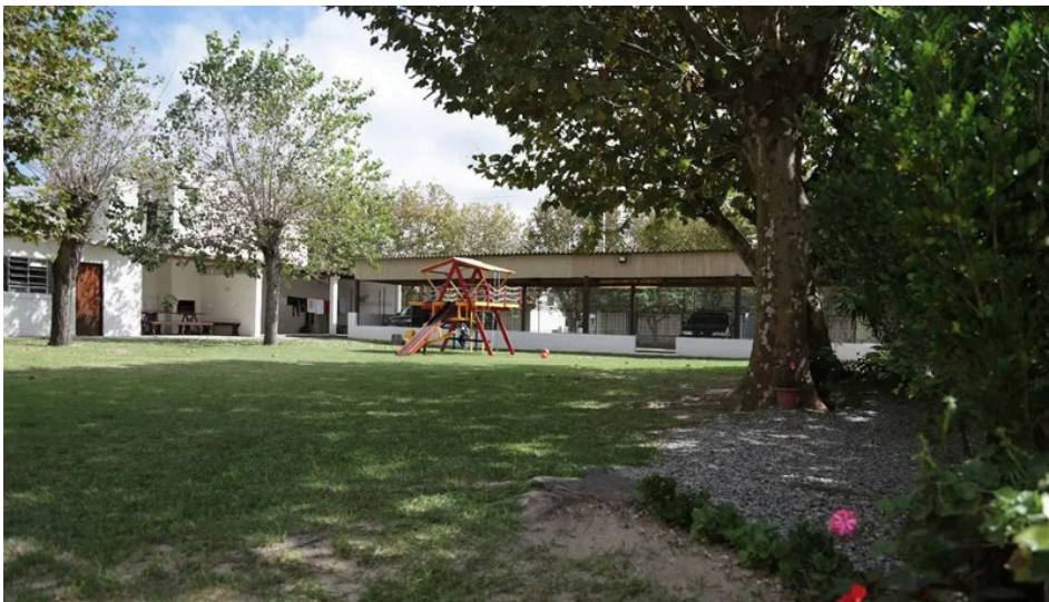
Ambiente acolhedor e as belezas de Cassino

O local conta ainda com churrasqueira coberta, churrasqueira externa e área de camping, atendendo diferentes perfis de associados que buscam lazer junto ao mar, seja no verão ou fora da alta temporada.