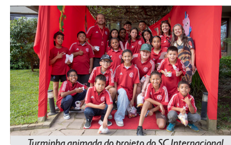
Turminha animada do projeto do SC Internacional

Internacional (FECI) foi convidada a participar, também colocando em prática sua proposta de promover ações de estímulo à cultura, à educação e ao esporte para crianças, adolescentes e seus familiares.