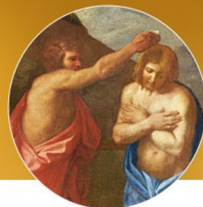
BAUTISMO DEL SEÑOR 1/11