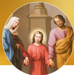
SAGRADA FAMILIA 12/28