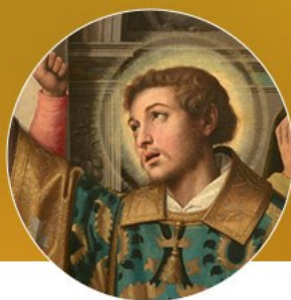
SAN ESTEBAN 12/26