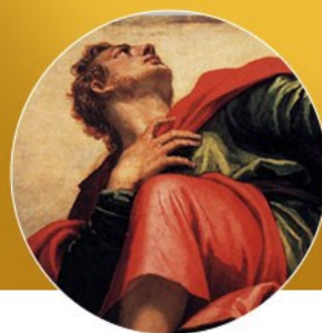
SAN JUAN, APÓSTOL Y EVANGELISTA 12/27