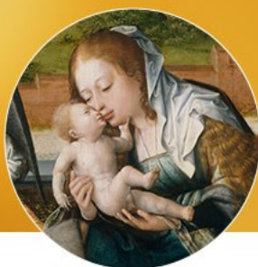
MARÍA, LA SANTA MADRE DE DIOS 1/1