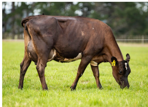
Tatawai daughter #42, PJ & PJ Rockell, New Pymouth