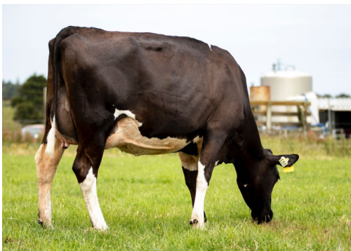
Tatawai daughter #159, PJ & PJ Rockell, New Pymouth

Valores de cría de toros probados del NZ Animal Evaluation run 27/4/2026 Valores de cría genómicos © CRV – publicado el 27/4/2026 | Frisón NZ