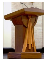
Bục Đọc Sách ( Ambo )