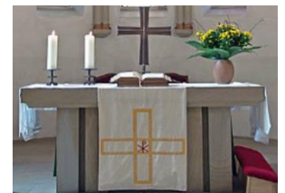
Bàn Thờ ( Altar )

2. Em lắng nghe và yêu mến Lời Chúa. ( I listen and love the Word of God. ) _____