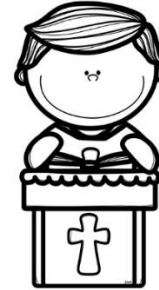
Bục Đọc Sách ( Ambo )