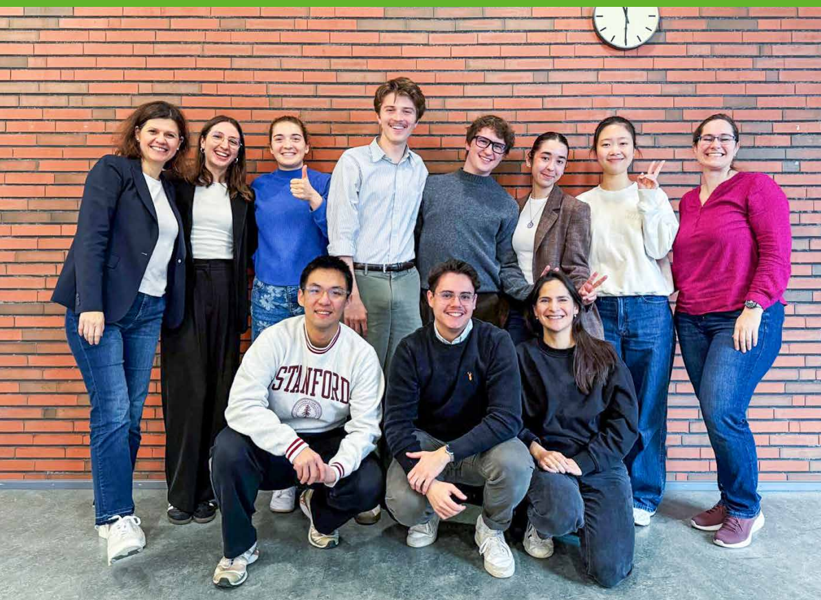
Studierende der ZHAW (Winterthur) und der Stanford University (Kalifornien) haben gemeinsam einen Prototypen entwickelt, der Container fur Medizinabfalle autonom offnet und Medizinprodukte via Machine Vision erkennt und sortiert.

Weiterfuhrende Informationen fur Mitglieder und Interessierte: be-circular.com