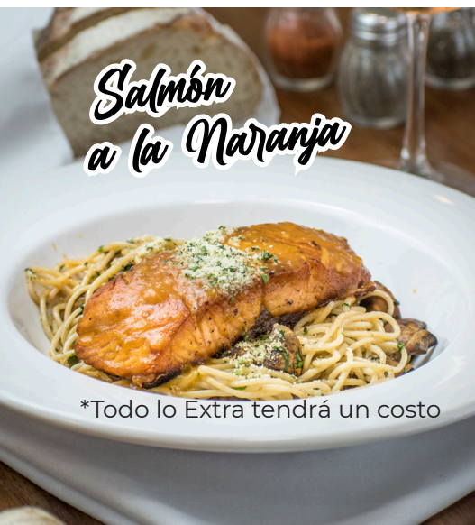
Salmon a la Naranja