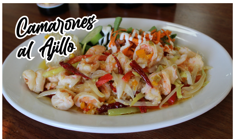
Camarones al Ajillo