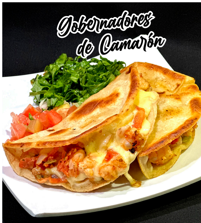
Gobernadores de Camarón