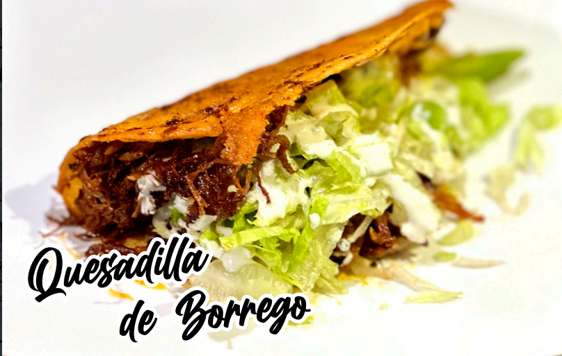
Quesadilla de Borrego