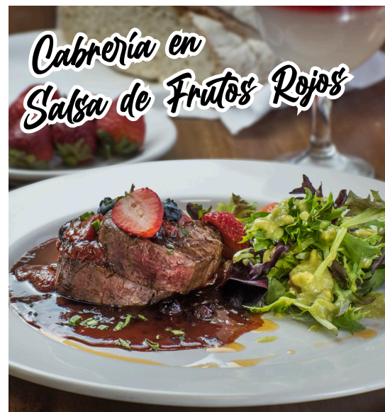
Cabrería en Salsa de Frutos Rojos