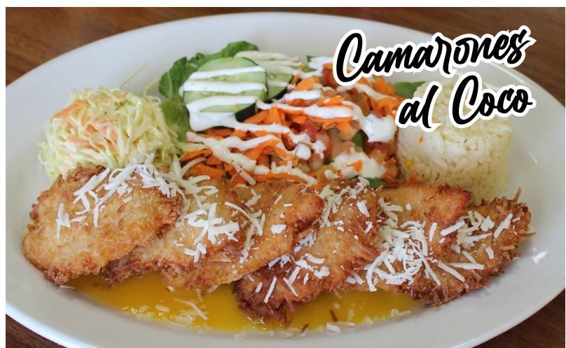
Camarones al Coco