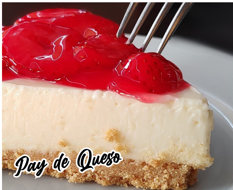
Pay de Queso