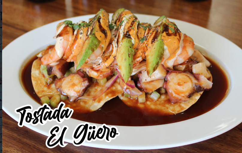
Tostada El Güero