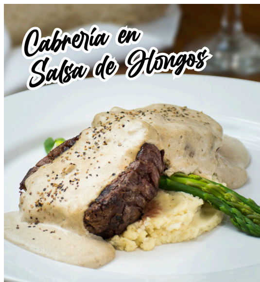
Cabrería en Salsa de Hongos