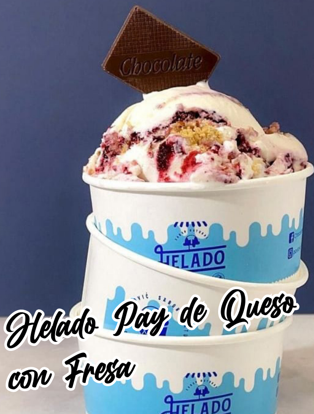
Helado Pay de Queso con Fresa