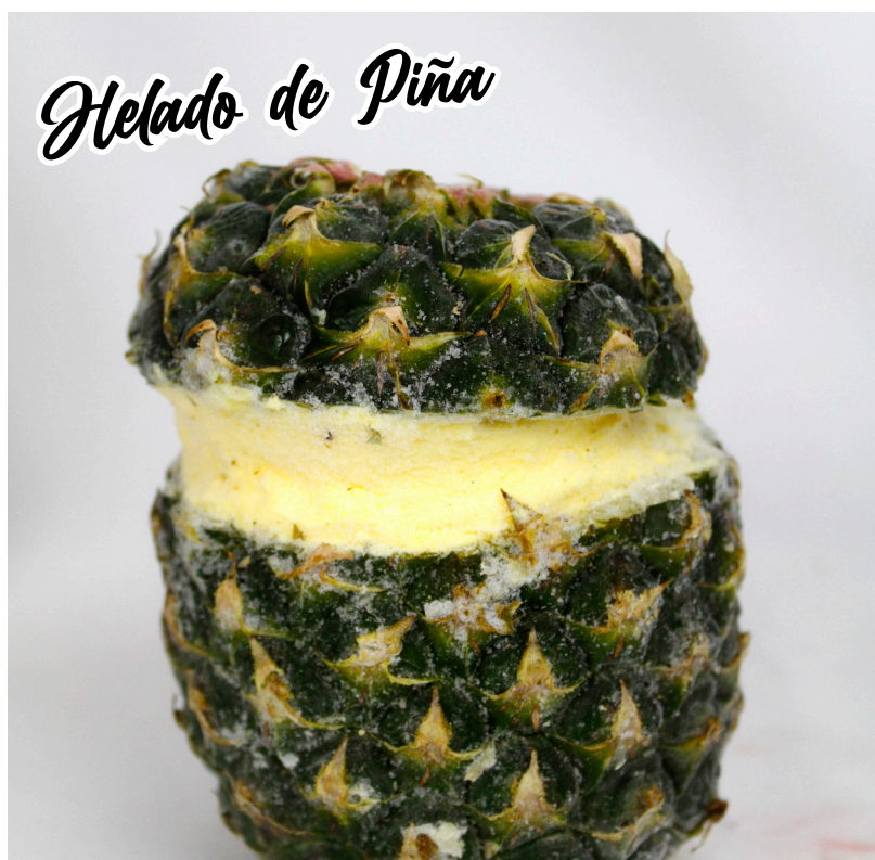
Helado de Piña