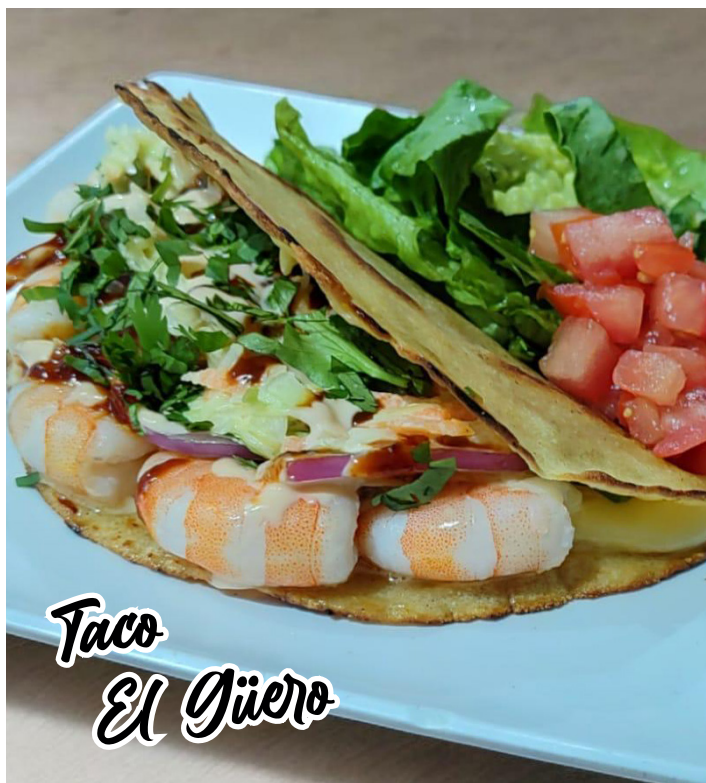
Taco El Güero