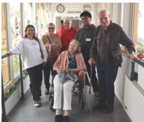
Raclette et visite de l'EMS La Champagne à Soral