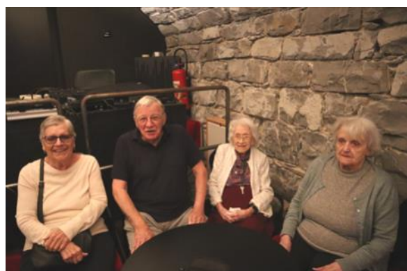
Thé dansant aux Caves de Bon Séjour à Versoix