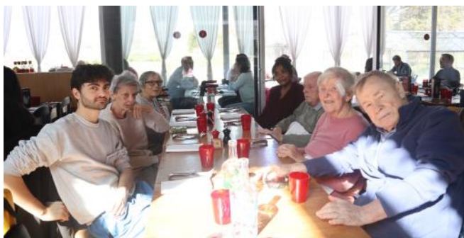
Sortie à la pizzeria Luigia