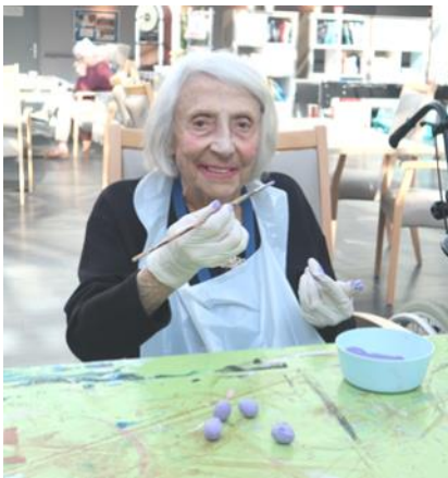
Préparation des décorations de Pâques