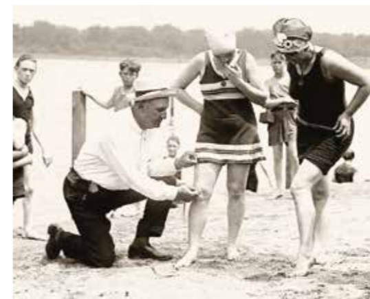
Un policier en civil mesure le maillot de bain d'une femme