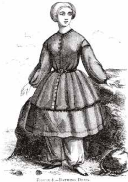
Figure 4. — BATHING DRESS. Femme en costume de bain, 1858

Et après cela ? Plus de signe du moindre maillot de bain. Au Moyen-Age, l'eau est accusée de transmettre des maladies et l'on évite donc soigneusement toute trempette prolongée.