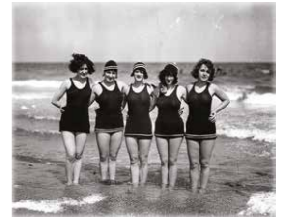
Femmes en maillots de bain en 1925

Les bains de mer se démocratisent avec les congés payés en 1936. Ils permettent à davantage de personnes de profiter des vacances à la mer, jusque-là réservées aux plus aisés.