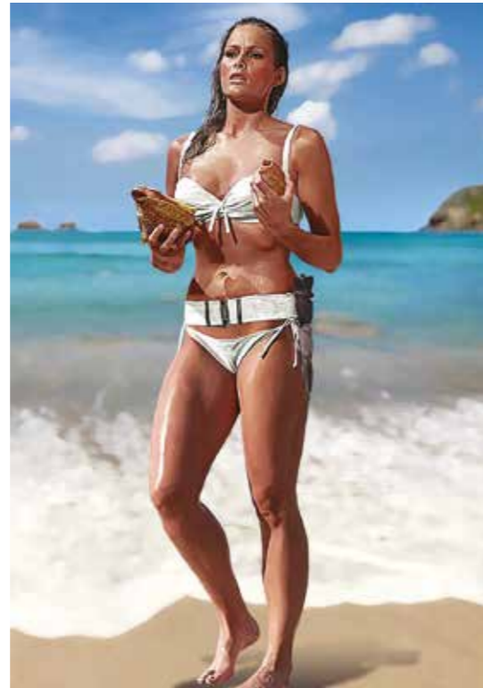
Ursula Andress dans « James Bond contre Dr No » en 1963

Chez les hommes, le trunk, une sorte de caleçon court sur les cuisses avec une ceinture s'impose aussi.