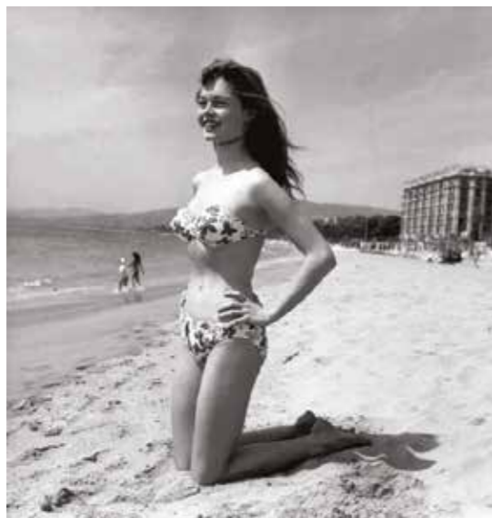
Brigitte Bardot à Cannes en 1952

Il faut attendre 1953 pour que le bikini reçoive un coup de pouce qui va faire décoller sa popularité. A 19 ans, Brigitte Bardot se prête à une séance photo sur la plage du Carlton. Elle y pose en bikini blanc à fleurs. En 1956, c'est sur grand écran que BB affole les hommes dans un bikini blanc devenu culte dans « Et Dieu créa la femme ». A quelques brassées de là, dans le premier volet de la saga James Bond, Ursula Andress sort elle de l'eau elle aussi dans un bikini blanc. La tendance est lancée !