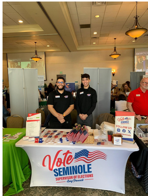
Exposición Empresarial de Seminole (Seminole Business Expo) Organizada por la Cámara del Condado de Seminole

Tenga en cuenta que la Oficina de la Supervisora de Elecciones del condado de Seminole permanecerá cerrada el lunes 16 de febrero, con motivo del Día de los Presidentes. Reanudaremos nuestro horario habitual al día siguiente.