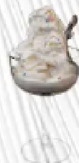
SORBETTO AL LIMONE