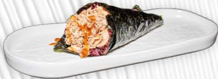
48A. TEMAKI BLACK MIURA 🍱 salmone cotto, philadelphia e salsa teriyaki € 5.00