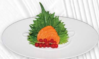
62. SASHIMI SALMONE € 12.00