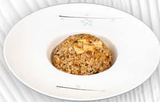
183. RISO CON SALMONE ○