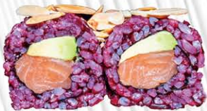
138. BLACK SALMONE ROLL salmone, avocado mandorle € 10.00