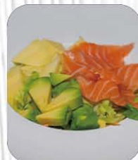
35. NAGOYA SALAD 🌿 insalata misti con salmone avocado e mango € 7.00