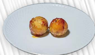
7. TAKOYAKI ❄️ 🍤 polpette di polpo fritte e salsa teriyaki € 7.00