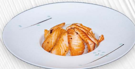
217. SAKE DON SALSA TERIYAKI