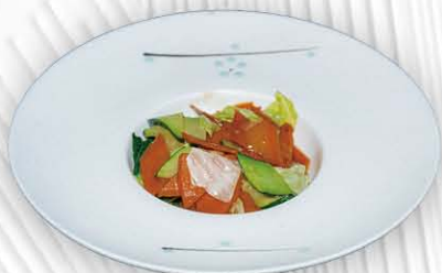
212. VERDURE MISTE SALTATE