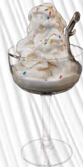
SORBETTO AL LIMONE € 4. 50