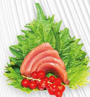
64. SASHIMI TONNO € 14.00