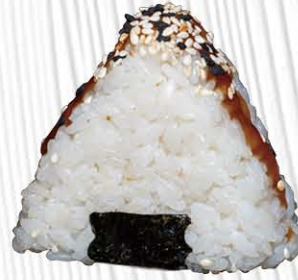
147. MIURA salmone cotto philadelphia salsa teriyaki € 4.00