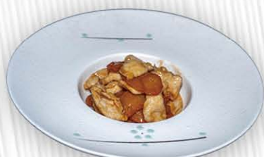
204. POLLO CON PATATE € 8.00