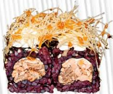
142. BLACK ROLL MIURA salmone cotto, philadelphia fuori con kataifi e salsa terityaki € 10.00