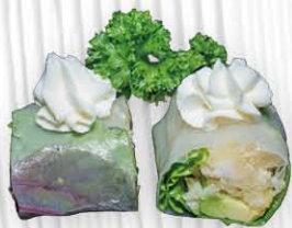
55. SPRING EBITEN ❄️🍷 tempura di gamberi, insalata, avocado avvolti da foglio vietnamita con philadelphia e salsa teriyaki € 10.00