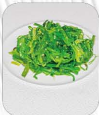
30. GOMA WAKAME ❄️🌿 alghe in salsa agro- piccante € 5.50