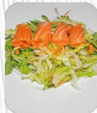
33. SALMONE SALAD 🌿 insalata mista, salmone e salsa sesamo € 7.00