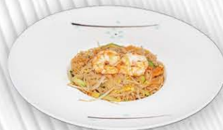
190. SPAGHETTI DI RISO SALTATO TRA VERDURE/GAMBERI/POLLO ○