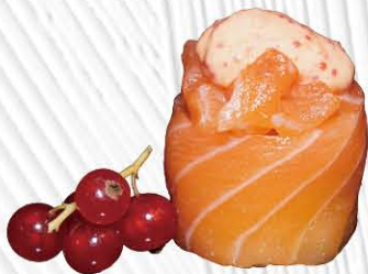
150. GUNKAN SALMONE OUT SPICY 🌶️ spicy salmone avvolto da salmone € 5.00