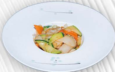
193. GNOCCHI DI RISO CON VERDURE MISTE 🍴 € 4.50