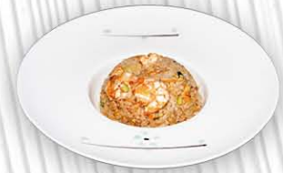
182. RISO CON GAMBERI ○