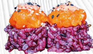
140. BLACK SPICY ROLL 🍣 salmone e fuori con spicy salmone € 10.00