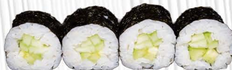
53. HOSSO CETRIOLO € 4.00