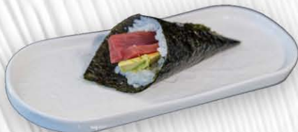
47. TEMAKI SPICY TUNA 🍱🔥 spicy tonno € 5.00