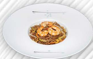
189. SOBA SALTATA SCEGLIERE TRA VERDURE/GAMBERI/POLLO ○ spaghetti di saraceno