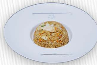
184. RISO CON POLLO AL CURRY ○