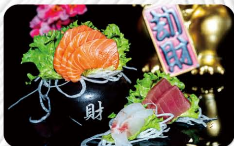
65. SASHIMI MISTO salmone, tonno, branzino € 15.00