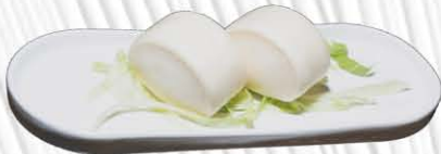
26. PANE GIAPPONESE ❄️🌿 pane al vapore € 6.00