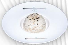
180. RISO BIANCO