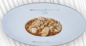
200. POLLO CON MANDORLE ❄️ 🍴 € 8.00