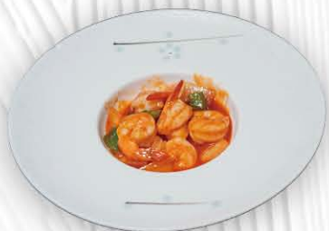
209. GAMBERI IN SALSA AGRODOLCE ❄️🌿