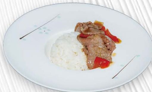
215. RISO CON MANZO PEPERONI SOPRA ❄️🌶️