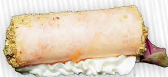
8. MINI CRISPY sfoglia croccante con spicy salmone philadelphia e pistacchio € 6.00