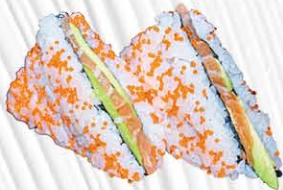
132. TRAMEZZINI 4PZ salmone, avocado e tobiko € 10.00