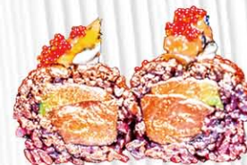
143. COLD 24KT 4PZ salmone, philadelphia tartufo con polvere d'oro e tobiko € 15.00