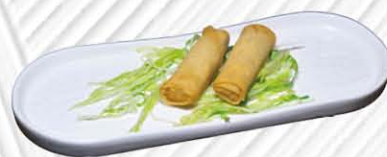
3. INVOLTINO DI PRIMAVERA ❄️ involtini di verdure € 3.50