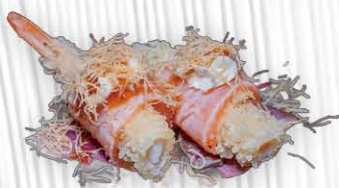
11. SALMONE LOUNGE ❄️ tempura di gamberi avvolto da salmone scottato, philadelphia, kataifi e salsa teriyaki € 8.00