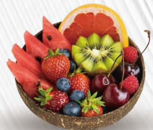
FRUTTA MISTA € 5. 00