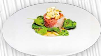
10. CEVICHE pesce misti con frutta e verdure e salsa tartar € 9.00