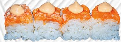
131. OSHI ZUSHI 🍣 riso, spicy salmone e salsa spicy € 11.00