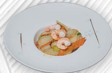
194. GNOCCHI DI RISO CON VERDURE E GAMBERI 🍴 € 5.00