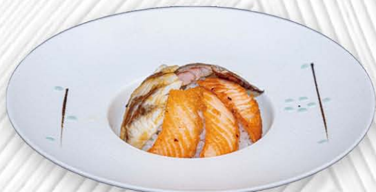
216 PESCE MISTE DON SALSA TERIYAKI