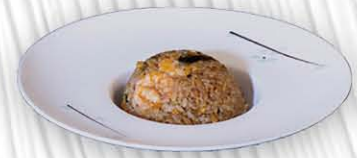
185. RISO THAIANDESE ○

gamberi, verdure miste e uova con salsa thai