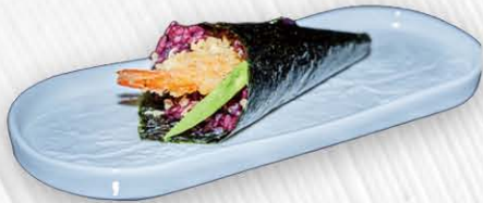
45A. TEMAKI BLACK EBITEN 🍱 tempura di gamberi e avocado salsa teriyaki € 5.00