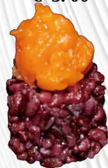
155. BUNNY EYES 🌶️ pallina di riso venere con spicy salmone sopra € 7.00