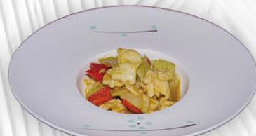
202. POLLO AL CURRY ❄️ pollo con peperone, cipolle e curry € 8.00