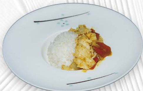
214. RISO CON POLLO CURRY SOPRA ❄️