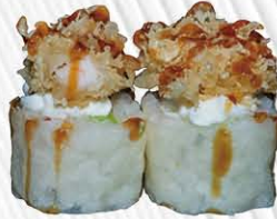
130. WHITE ROLL 🍣 sfoglia di soia, salmone, avocado fuori philadelphia e gamberi fritto con salsa passione fruit € 11.00