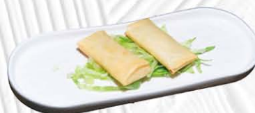
6. HARUMAKI ❄️ involentino con gamberi pollo e verdure € 5.00