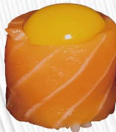
154. GUNKAN SALMONE OUT GUAGLIA uova di quaglia avvolto da salmone € 6.00