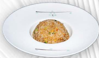
186. RISO CON VERDURE ○