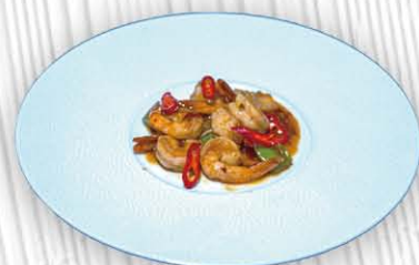
211. GAMBERI IN SALSA PICCANTE ❄️🌶️