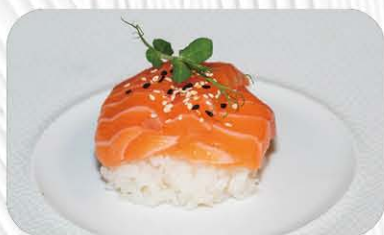
58. CHIRASHI SAKE salmone e riso € 14.00