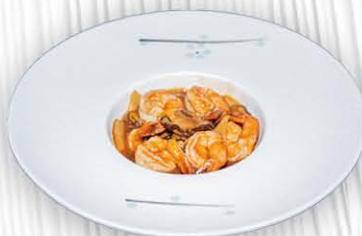
210. GAMBERI CON FUNGHI E BAMBU ❄️🌿