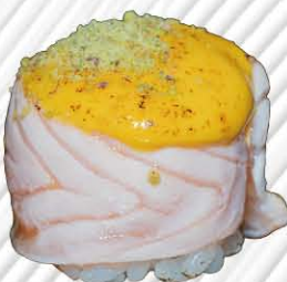
156. GUNKAN SALMONE FLAMBE salsa flambè avvolto da salmone scottato e pistacchio € 5.50