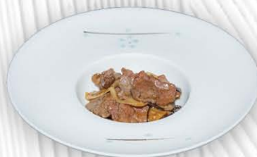
205. MANZO CON FUNGHI E BAMBU ❄️ € 8.00