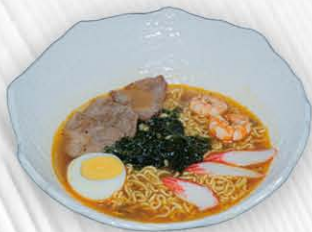
192. RAMEN CON MANZO/GAMBERI 🍴 spaghetti in brodo con manzo gamberi, alghe e uova [PICCANTE O NON PICCANTE] € 8.00