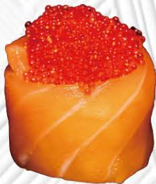
153. GUNKAN SALMONE OUT TOBIKO tobiko avvolto da salmone € 5.50