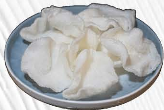
1. NUVOLE DI DRAGON € 3.50