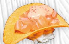
9. TARTAR TAPPET chips di patate philadelphia, spicy di salmone € 7.00