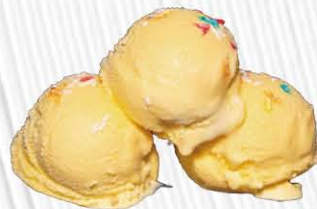
GELATO CREMA € 4. 50