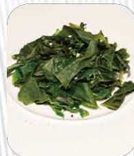
31. ALGHE WAKAME 🌿 alghe giapponese con salsa sesamo € 5.00