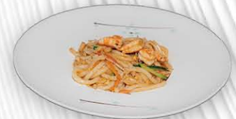
188. UDON SALTATO SCEGLIERE TRA VERDURE/GAMBERI/POLLO ○