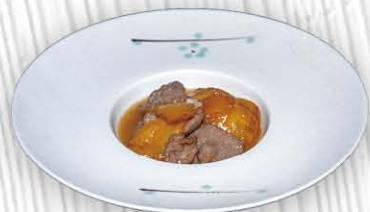
206. MANZO CON PATATE ❄️ € 8.00