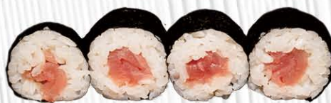
51. HOSSO TONNO € 5.00