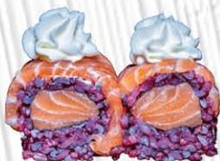
141. BLACK OUT ROLL salmone, philadelphia avvolto da salmone € 12.00