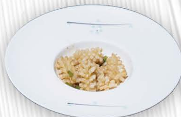
213. CALAMARI IN SALE E PEPE ❄️