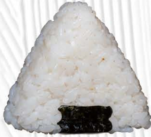
146. MAGURO tonno cotto e maionese € 4.00