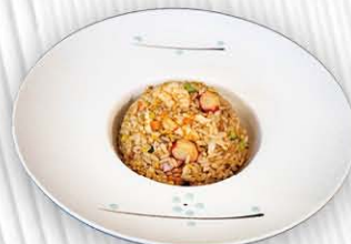
187. RISO MISTO MARE ○