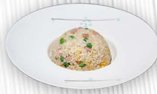
181. RISO CANTONESE ○