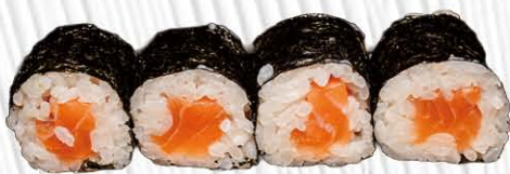
50. HOSSO SALMONE € 4.00