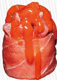
151. GUNKAN TUNA OUT SPICY 🌶️ spicy tuna avvolto da tonno € 5.50