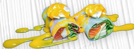
56. SPRING SALMONE salmone, insalata, mango, avocado, philadelphia e salsa mango avvolto da foglio vietnamito € 10.00