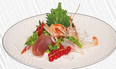
66. SASHIMI MISTI SPECIALE 1 salmone, tonno, branzino, scampi e gambero rosso € 20.00