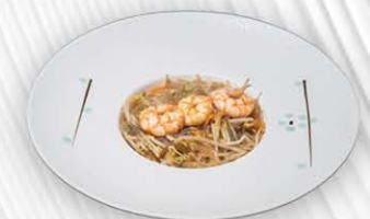
191. SPAGHETTI DI SOIA SALTATO TRA VERDURE/GAMBERI/POLLO ○