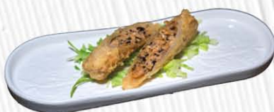
5. INVOLTINO DI VIETNAMITA ❄️ sfoglia di riso con carne spaghetti di soia e verdure € 4.50