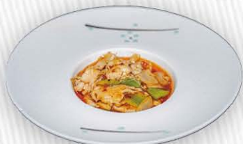
201. POLLO IN SALSA PICCANTE ❄️ 🔥 pollo con peperone, cipolle e salsa piccante € 8.00