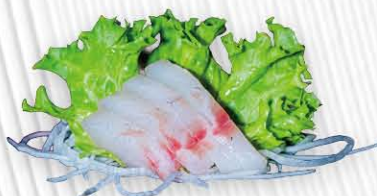
63. SASHIMI SUZUKI (branzino) € 14.00