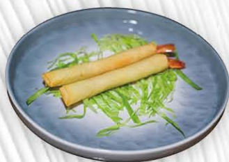
4. INVOLTINI DI EBI 🍤 involtini ai gamberi € 4.50