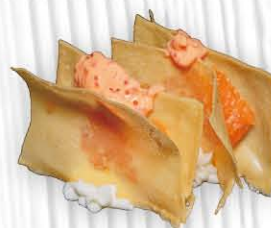
12. MILLEFOGLIE SAKE pasta sfoglia con spicy salmone, philadelphia € 6.00