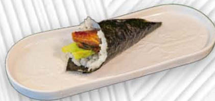
48. TEMAKI ANGUILLA 🍱 anguilla e avocado salsa teriyaki € 5.00