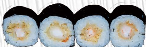
54. HOSSO EBITEN 🍱❄️ tempura di gamberi, salsa teriyaki € 5.00