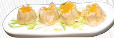
24. GYOZA DI GAMBERI ❄️🌿 ravioli di gamberi € 5.00