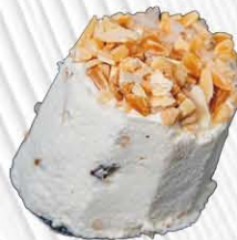
TORONCINO € 5. 00