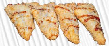
NUTELLA FRITTA € 5. 00