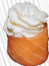
152. GUNKAN SALMONE OUT PHILA philadelphia avvolto da salmone € 5.00