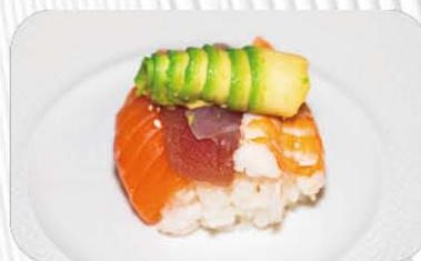
59. CHIRASHI MIX salmone, tonno, branzino, gamberi e avocado € 14.00