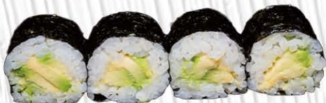
52. HOSSO AVOCADO € 4.00