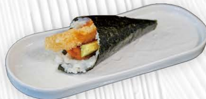
49. TEMAKI SAKE EBITEN 🍱 spicy salmone, tempura di gamberi avocado e salsa miele € 5.00