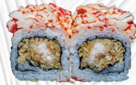
134. CALIFORNIA EBITEN ❄️ tempura di gamberi fuori surimi e maionese € 12.00