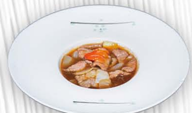
207. MANZO IN SALSA PICCANTE ❄️ 🔥 manzo saltato con peperoni e piccante € 8.00