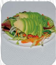
32. AVOCADO SALAD 🌿 insalata mista, avocado e salsa sesamo € 6.00