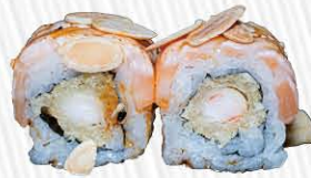
133. SPECIALE NAGOYA TIGER ❄️ tempura di gamberi fuori salmone cotto mandorle e salsa miele € 12.00