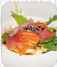
34. PESCE MISTI SALAD 🌿 insalata misti, pesce misti e salsa sesamo € 7.50