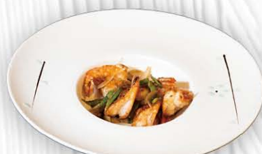
208. GAMBERI IN SALE E PEPE ❄️ gamberi, peperoni e cipolle € 8.00