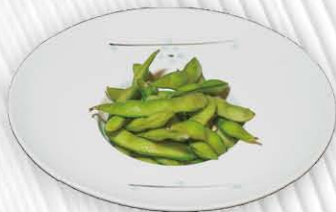
2. EDAMAME fagioli di soia € 4.00