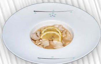
203. POLLO AL LIMONE pollo saltato con limone € 8.00 ❄️ 🍴