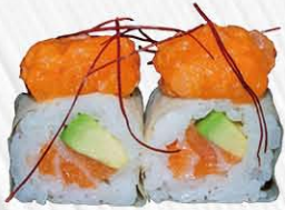
129. SOFT ROLL 🍣 sfoglia di soia, salmone, avocado, fuori spicy salmone € 9.00