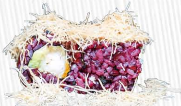
139. BLACK EBITEN ROLL ❄️ tempura di gamberi, avocado, fuori kataifi e salsa teriyaki € 10.00