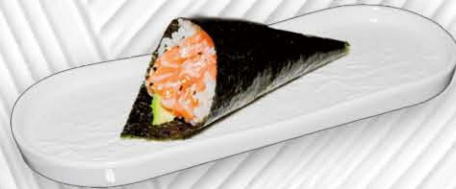
46. TEMAKI SPICY SALMONE 🍱🔥 spicy salmone € 5.00