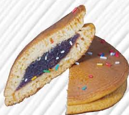
DORAYAKI € 5. 00