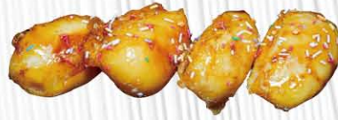
MELE CAMELLATA € 5. 00