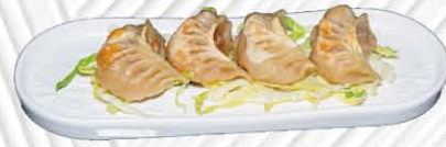
22. GYOZA GRIGLIA ❄️🌿 ravioli di carne alla griglia € 4.00