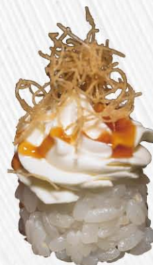
157. GUNKAN BIANCANEVE 🍴 pallina di riso con philadelphia sopra kataifi e salsa teriyaki € 4.00