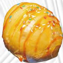
GELATO FRITTO € 5. 00