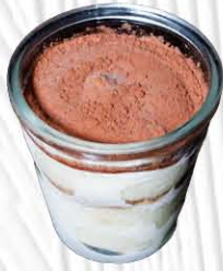
TIRAMISU € 5. 00