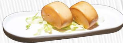
27. PANE FRITTO ❄️🌿 € 6.00