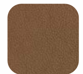
Couro Soft Sépia